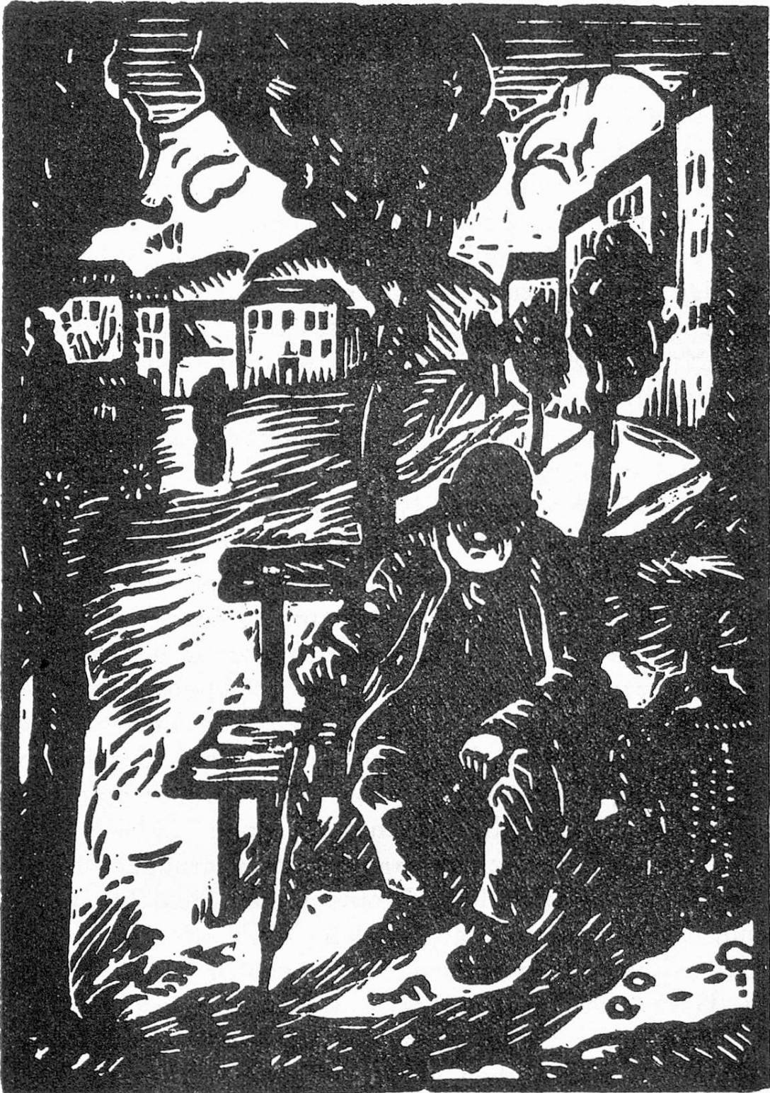
Der alte Hausierer.