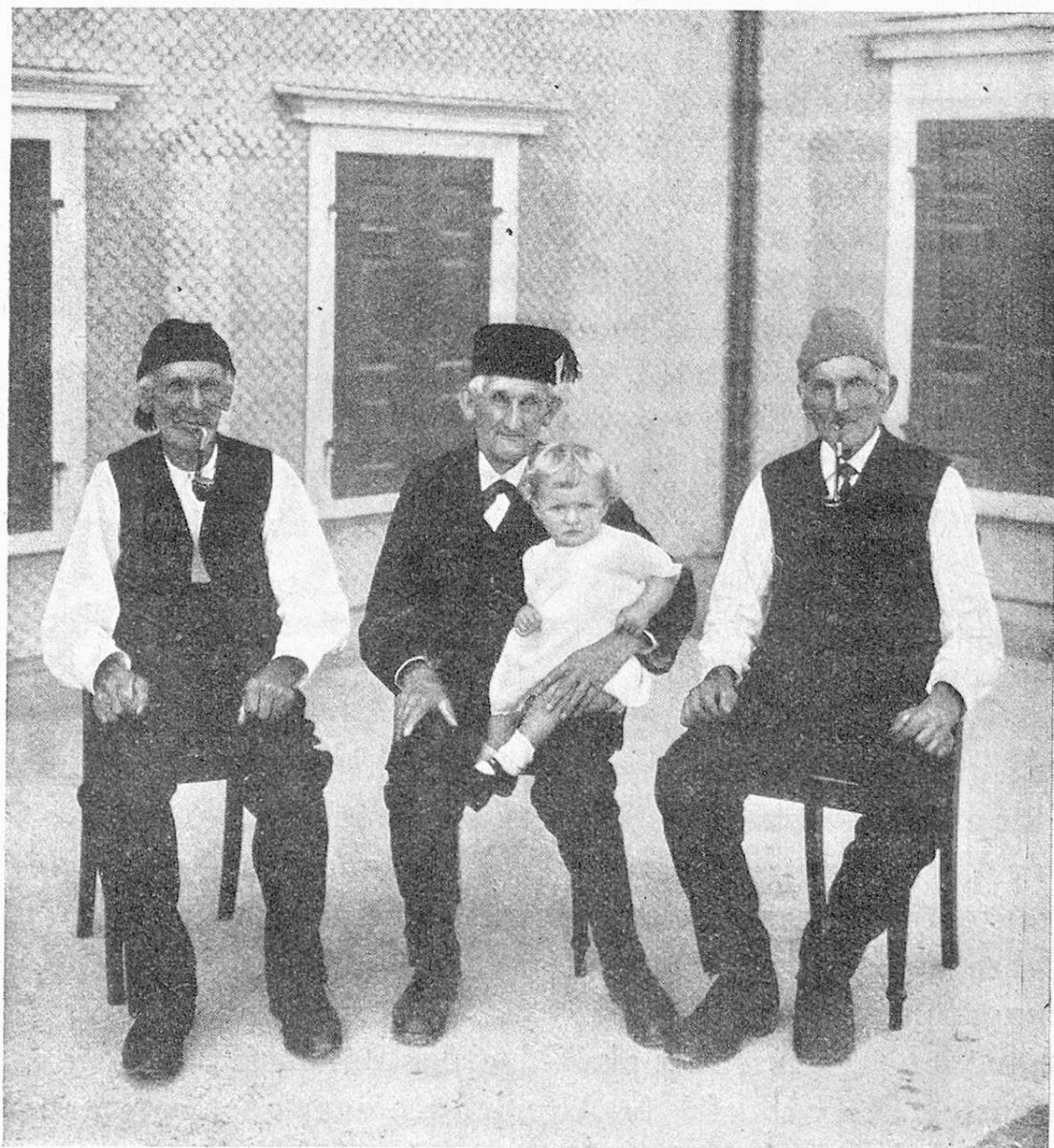
Appenzeller Kind mit seinen drei Urgroßvätern.

ist im Vergleich zum Vorjahre die Zahl ihrer Schützlinge um 906 Personen gestiegen, während die Unterstützungssumme bloß um Fr. 37,000.— erhöht werden konnte, sodaß die durchschnittliche Jahresunterstützung von Fr. 100.— auf Fr. 96.— gesunken ist. Das Gesamtergebnis der kantonalen Sammlungen hat 1927 mit Fr. 790,559.— eine Höhe erreicht, welche eine wesentliche Steigerung nicht mehr erwarten läßt, zumal die Ankündigung der Bundes-subvention unmittelbar vor Beginn der diesjährigen Herbstsammlung viele Geber eher zurückhaltend gestimmt haben dürfte.