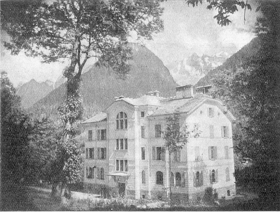
Asilo-Ospedale del Val Bregaglia a Spino.

tenere il loro bestiame sempre o quasi sempre nella stessa stalla; poichè a motivo del foraggio sono obbligati a condurre le loro bestie in diverse stalle nel corso di un anno, in stalle di cui alcune distano non poco dalle abitazioni.