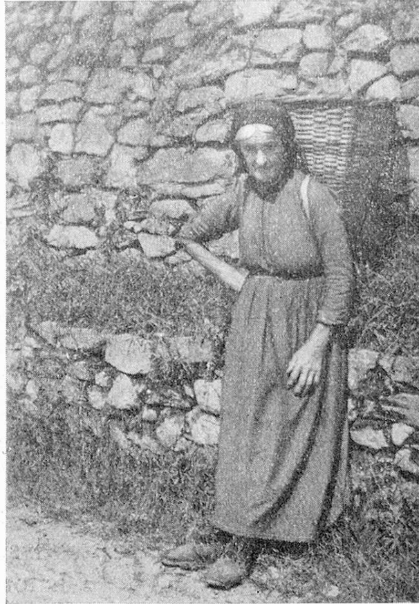
Alte Tessinerin aus dem Maggiatal. Stanca dalla fatica.

Die durchschnittliche Jahresunterstützung von Fr. 100, gewiß ein äußerst geringes Existenzminimum, konnte von der Stiftung in den letzten Jahren nicht mehr aufrecht erhalten werden. Von Fr. 100.60 im Jahre 1926 ist sie