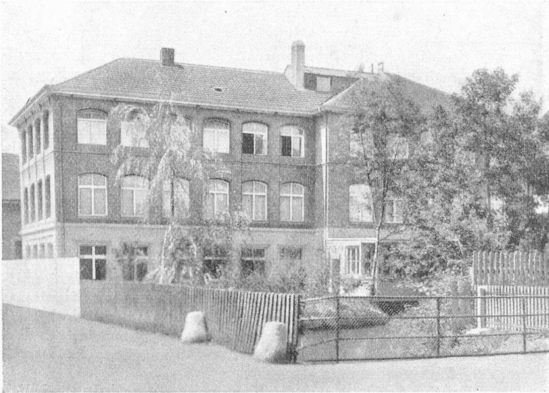
Vue générale de l'ancienne fabrique FRECO, transformée en camp de réadaptation horlogère.