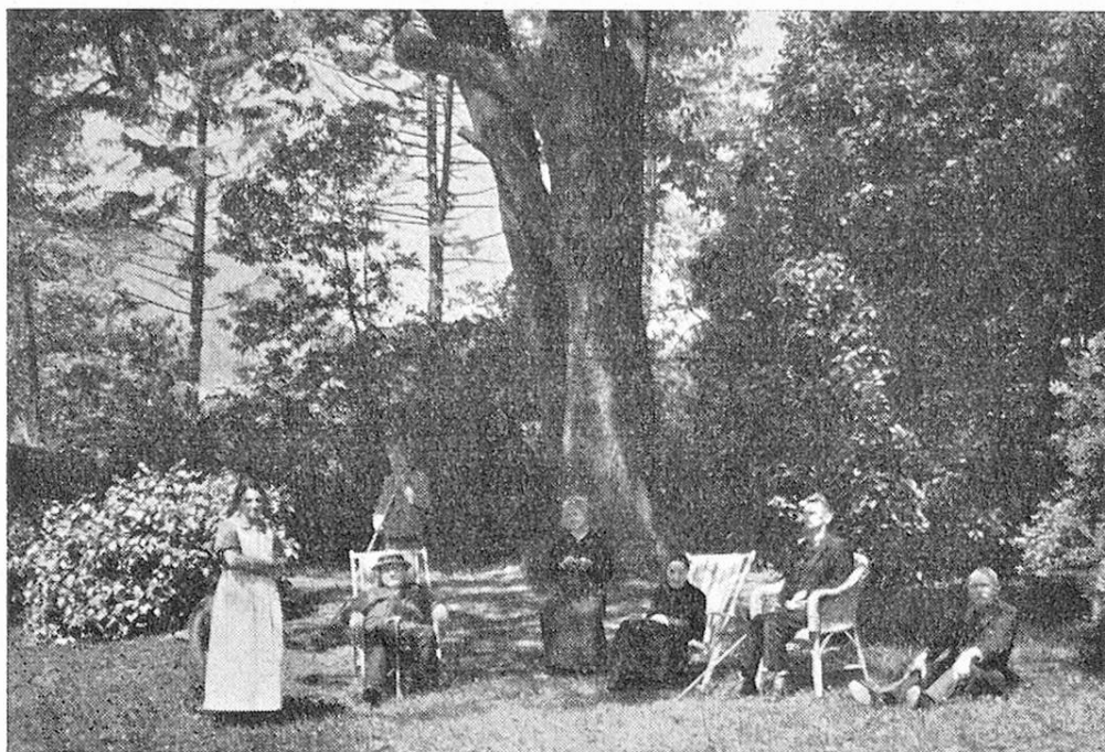
Ricoverati nel giardino.

esotiche che richiama l'attenzione di tutti; un' orto affidato alle cure dei ricoverati, diretti da persona del mestiere; un vasto frutteto che si estende sul pendio della collina restrostante.