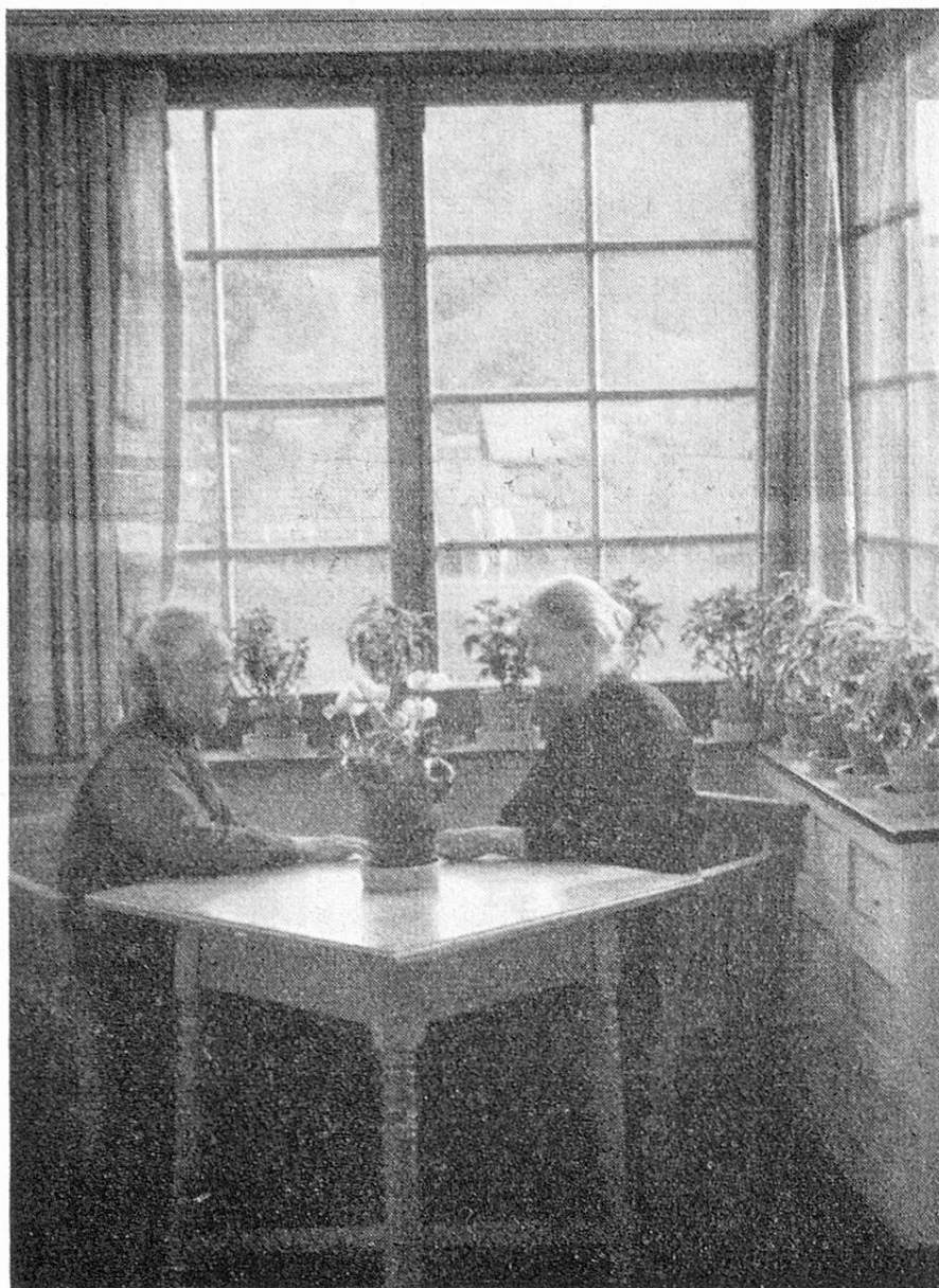
Im trauten Stüblein: Zwei Pensionärinnen des evangelischen Talasyls des Bündner Oberlandes in Ilanz.

nach verschiedenen Richtungen hin erweitert (durch Aufnahme von erholungsbedürftigen Frauen und Müttern z. B.). Auch für die schon anfangs unter die Zwecke des Asyls aufgenommene Förderung der häuslichen Krankenpflege in den Gemeinden ist schon manches geschehen.