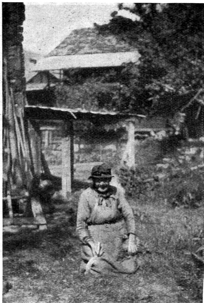
Paysanne de la vallée de Bagnes coupant l'herbe avec la faucille.

à gauche. Une cloche agitée d'une main vigoureuse avertit les pensionnaires que c'est l'heure de la réfection. Et vous voyez arriver qui, appuyé sur une canne, qui se tenant au mur, un troisième boitillant, mais tous très dociles à cette voix aimée. Profitons de ce moment pour faire connaissance avec nos hôtes. Les hommes sont au nombre de douze pour l'instant, presque tous ressortissants de la Commune de Bagnes.