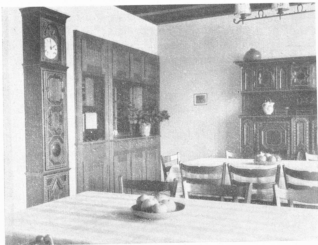
Das Eßzimmer des Altersheims Laupen.

gegenseitige Aushilfe mit Personal und Räumlichkeiten möglich. Das gemeinsame Wirtschaftsgebäude bildet den Mittelbau: er enthält unter der Erde die Heizungsanlage, im Parterre den Haupteingang, ein kleines Büro für den Empfang, die Küche und zwei Zimmer für das Küchenpersonal und die Altersheimschwester.