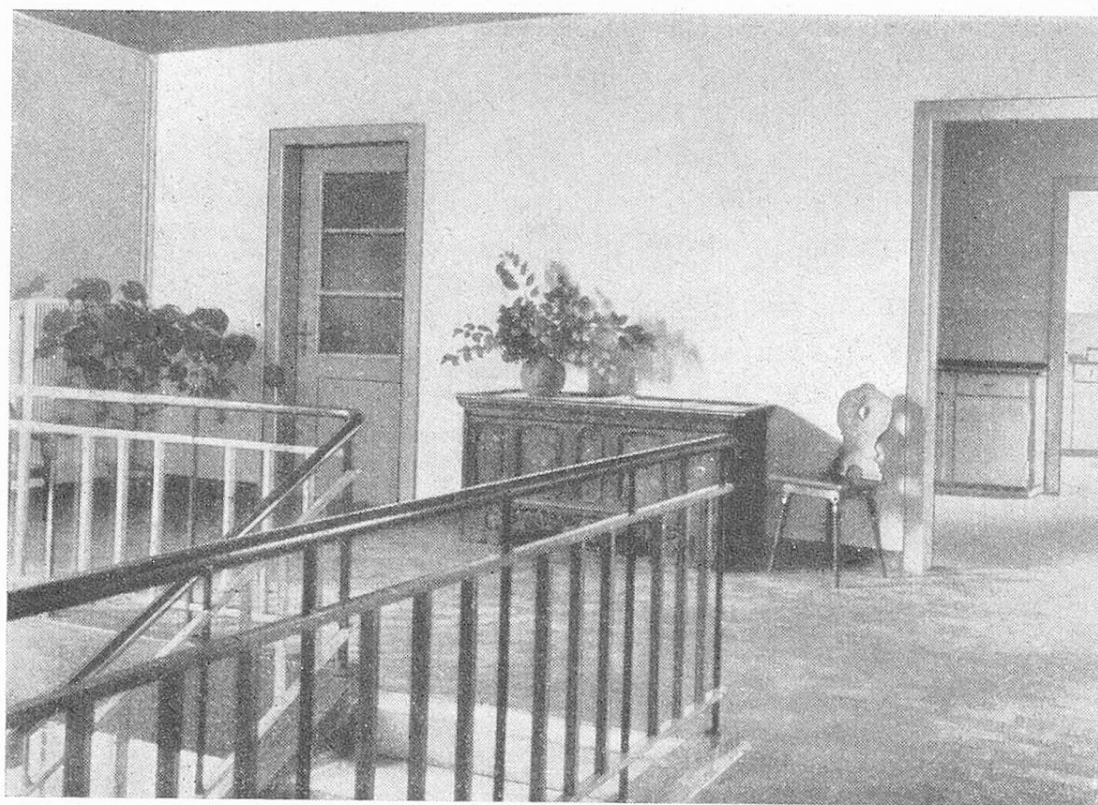
Das Treppenhaus des Altersheims Laupen.

1942 ein Verein „Kranken- und Altersheim des Amtsbezirkes Laupen“ als gemeinsame Dachorganisation gegründet. Am 14. September 1942 wurde der Bau begonnen.