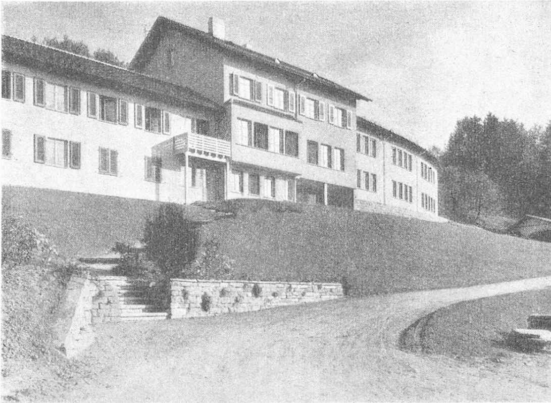
Gesamtansicht des Alters- und Krankenheims Laupen.

war man von der Idee eines Spitals mit Operationseinrichtungen abgekommen, die in der Nähe Berns nie voll ausgenutzt werden könnten. Der Projektverfasser für ein Altersheim, Architekt Ernst Indermühle in Bern, entwarf rasch einen Plan, der dem heutigen Bau zugrunde liegt. Dieses Projekt zerstreute die noch vorhandenen Bedenken, besonders die Befürchtung, die Nähe eines Spitals wirke auf Altersheiminsassen ungünstig.