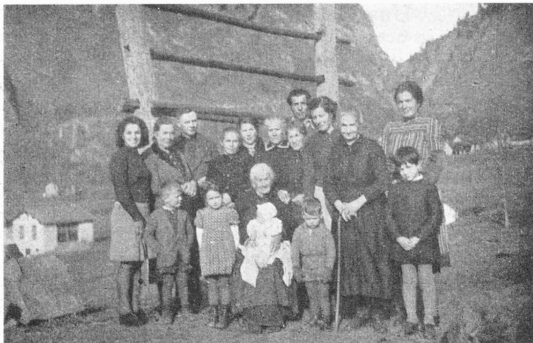
La centenaria circondata dalla sua famiglia

fonda le fece accettare la sventura serenamente e le permise di prodigare i tesori del suo cuore nei nuovi focolari che si accendevano a lei d'intorno. Circa 150, fra nipoti e pronipoti, costituiscono ora la sua gioia, il suo orgoglio.