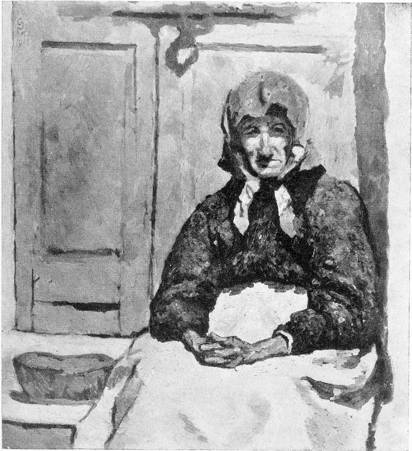
Giovanni Giacometti, Vecchia contadina della Val Bregaglia Alte Bergeller Bäuerin