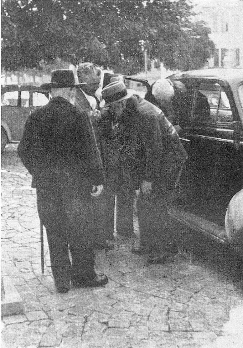
Altleutetag Herisau: Gebrechliche werden durch Autobesitzer abgeholt

Kantone an die Fürsorgearbeit der Stiftung „Für das Alter“. Im Jahre 1926 ist der Kanton Basel-Stadt vorangegangen mit der Einführung staatlicher Altersbeihilfen, welche von einer Reihe von Stadt- und Industriegemeinden und einer Anzahl von Kantonen nachgeahmt wurden. Im Jahre 1929 hat der Bund mit einer bescheidenen Unterstützung bedürftiger Greise durch die Stiftung „Für das Alter“ angefangen. Nach der Verwerfung des Bundesgesetzes über die Alters- und Hinterlassenenversicherung Ende 1931 wurde er zum Ausbau seiner Alters- und Hin-