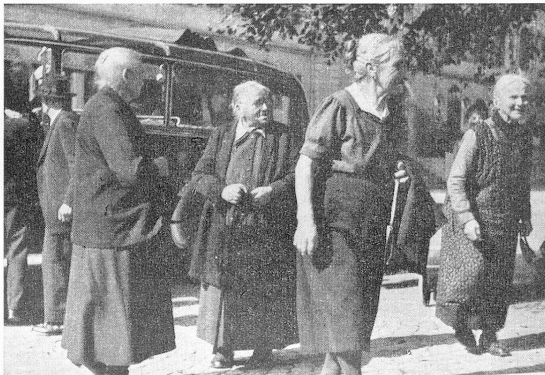
Journée des vieilles gens à Herisau: Cette fois c'est notre tour d'aller en auto à une fête

assurance-invalidité fédérale n'est possible, selon notre constitution fédérale, qu'après l'organisation de l'assurance-vieillesse et survivants. Certains de nos comités cantonaux sont déjà en mesure de venir en aide à des vieillards nécessiteux de 60—65 ans prématurément invalides. La fondation pourra les secourir encore davantage une fois l'assurance réalisée.