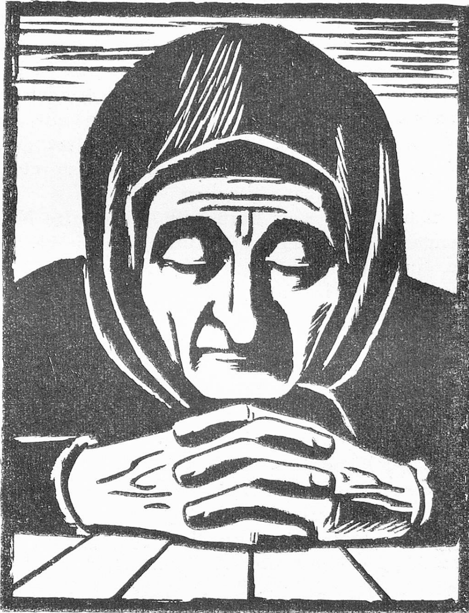
E. Keller: Resignation

ten sich an die Armenpflege wenden, welche die bedürftigen Greise und Greisinnen meist im Armenhaus versorgte. Bloss ausnahmsweise fanden sie in einem städtischen Pfrundhaus oder in einem Altersheim eine bessere Unterkunft. Lange blieb der Ruf nach einer Altersversicherung ohne Widerhall, weil die Kranken- und Unfallversicherung als dringlicher erachtet wurde und die Meinung vorherrschte, die Not des Alters sei nicht sehr verbreitet und in der Regel selbstverschuldet.