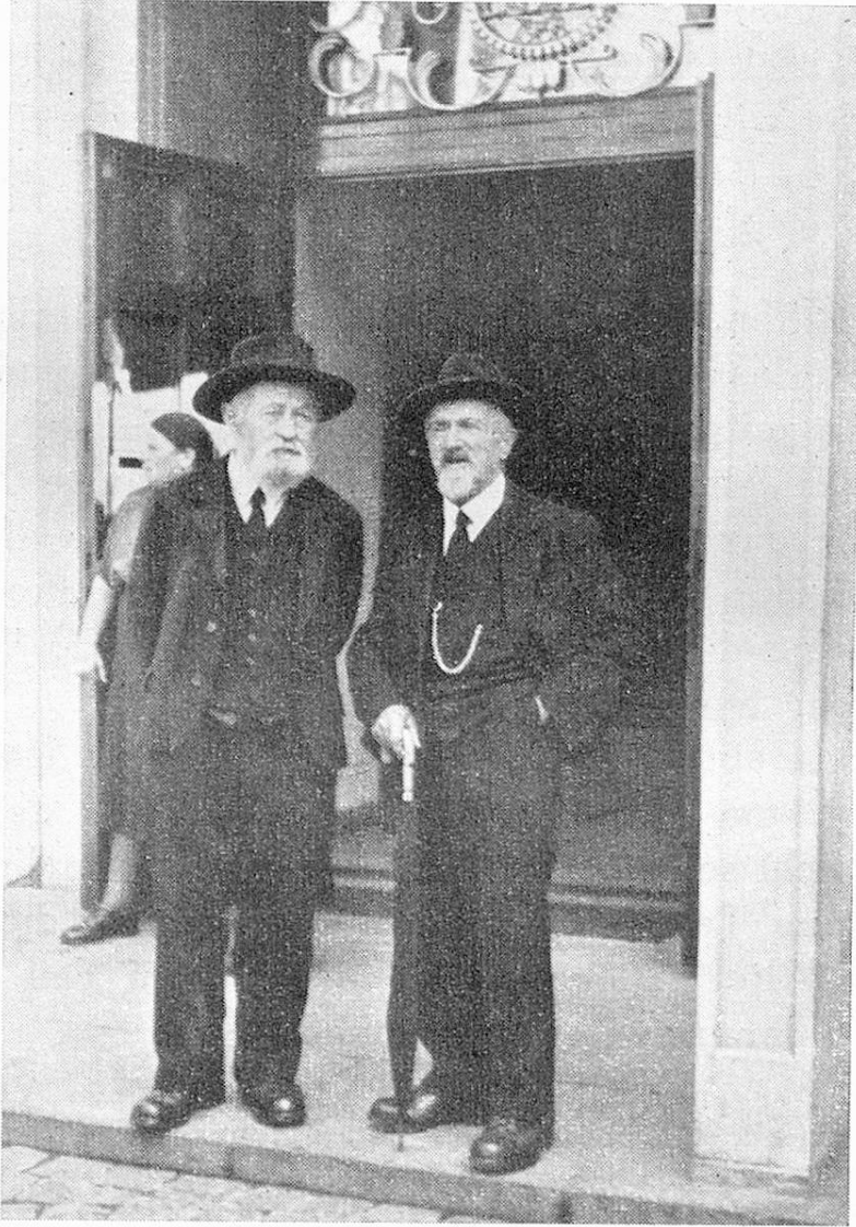
Altleitetag Herisau: Appenzeller im Sonntagsstaat warten vor dem Saaleingang

4. schliesslich für Schweizer und Schweizerinnen, welche zwar die volle oder eine gekürzte Altersrente erhalten, aber infolge Krankheit, Unfall, Überschuldung oder aus andern Gründen ohne eine zusätzliche Hilfe der Stiftung armengenössig würden.