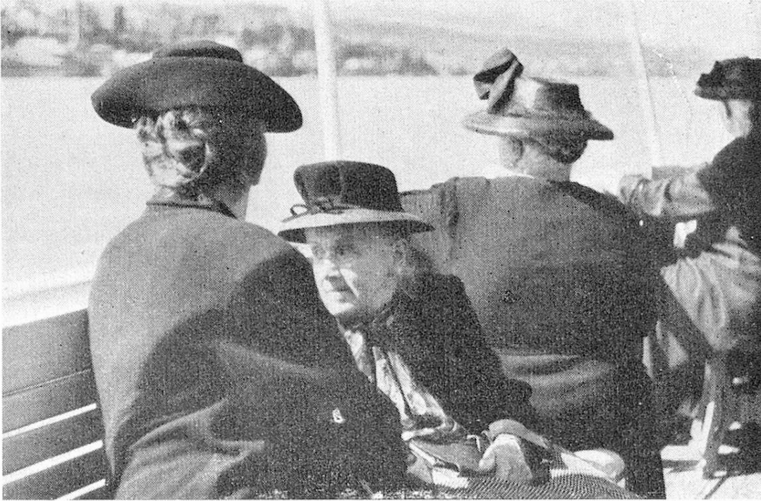
und bewundern die schöne Landschaft

und Winken. Bald kehrte man der Stadt den Rücken und fuhr dem linken Ufer nach seeaufwärts. Nun lösten sich die Augen und Gedanken der müden Erdenpilger vom Alltag los und gaben sich völlig dem Genuss der schönen Landschaft hin. Kaum bedurfte es der ermunternden Klänge der Handorgel, welche von einer Gruppe junger Mädchen gespielt wurde, um erst zaghaft, dann herzhafter längst versunkene alte Schullieder wie „Ich bin ein Schweizerknabe und hab die Heimat lieb“ anzustimmen und mitzusingen. Auch die Zungen lösten sich und bisher Unbekannte fanden sich im traulichen Gespräch.