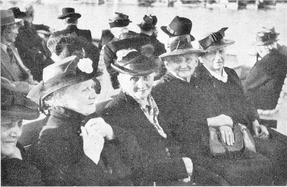
Froh geniessen sie die Fahrt