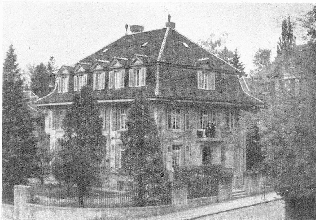
Das neue Altersheim Sonnhalde des Vereins „Für das Alter“ Bern-Stadt

Fürsorge kann heute nicht mehr nur darin bestehen, dass wir dem Notleidenden die äusserlichsten notwendigen Mittel, nämlich einen regelmässigen Geldbeitrag geben. Wir müssen ihn in den meisten Fällen nicht nur einmal oder von Zeit zu Zeit mit Geld oder Sachen „unterstützen“, sondern er muss gestützt werden, wenn er das Geld oder andere Wohltaten sinnvoll verwenden und anwenden soll. Gewiss bedeutet eine solche Stützung immer zunächst, dass wir den in einen äusseren oder inneren Notstand geratenen jungen oder alten Menschen umzuerziehen versuchen wollen. Wo dieser Versuch aber nicht gelingt, da müssen wir ihm dauernd Stab und Stütze bei seiner Lebensgestaltung bleiben. Hieraus ist ersichtlich, dass die neuzeitliche Fürsorge nicht mehr nur geben will, sondern dass sie auch fordert, dass sie an die Gaben ihre Bedingungen knüpfen muss. Fürsorge ist also nicht, wie dies immer wieder so gemeint wird, eine Geste des zufällig erwachten Mitleidens, nicht nur ein Ausdruck eines Gefühls, sondern auch eine