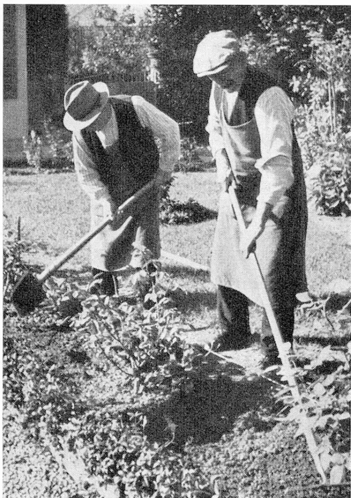
Alte Insassen bei der Gartenarbeit

das Jahr beginnt und dennoch die 110 Insassen ernähren und das Haus den Bedürfnissen der alten Leute anpassen kann. Da der hl. Josef auch etwas wusste von der Sorge ums tägliche Brot, ist er als Schutzpatron des Hauses ernannt. Sein Ehrentag ist ein besonderer Freudentag.