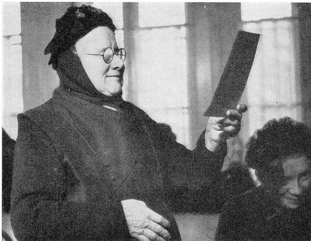
Eine greise Insassin singt vor

durchhalten, in zwei Jahren eine grössere Wohnung und in drei Jahren ein geräumiges Haus beziehen mit der entsprechenden Anzahl Schützlingen und selbstlosen Helferinnen. Dieses schlichte Liebeswerk eroberte sich das Herz des französischen Volkes. Arm und Reich unterstützten die Kleinen Schwestern, „ petites sœurs des pauvres “, denen das Volk diese Benennung gab. Hafenarbeiter gaben ihren Wochen-sous, Begüterte schenkten Land und ansehnliche Summen. Haus um Haus konnte gegründet werden in Europa und über Europa hinaus in Amerika, Asien, Afrika und Australien. Heute betreuen die Schwestern 51 000 Greise in 307 Häusern.