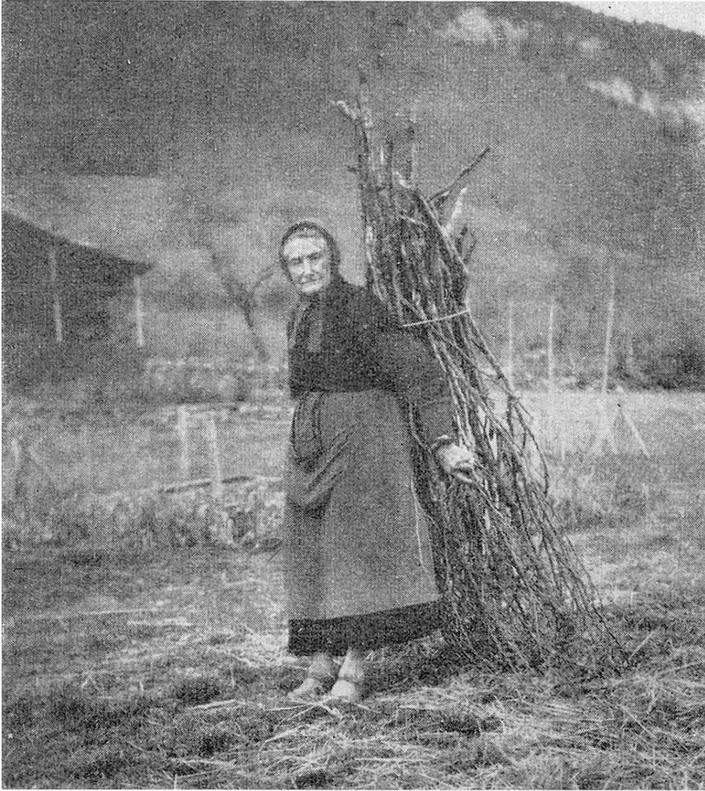
Neuchâteloise, âgée de 92 ans, rentrant avec un fagot de bois

mettre un balcon de bois pour que je puisse aller m'y reposer . . . quand . . . je serai . . . vieille!"