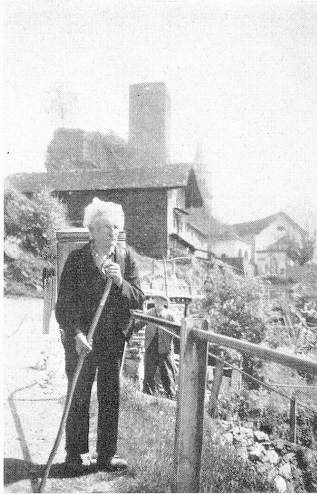
Tornato da Parigi alla terra natia

i quali dopo la lunga assenza poterono portare a casa qualche risparmio per rendere la vecchiaia meno stentata, più decorosa. La maggior parte tornava priva di salute ed altrettanto di mezzi di esistenza. I figli a loro volta emigrati ed in parte anche stabilitisi con le loro famiglie altrove non erano in grado di soccorrere i loro genitori. Così non di raro si recavano gli oltre ottantenni ad accudire ai pesantissimi bisogni agricoli o a qualche lavoro di guadagno accessorio seppure minimo. Una buona parte di essi in vedovanza e con familiari lontani abitano tutt'ora nelle casette soli soletti provvedendo a stento al proprio sostanziamiento, ai lavori di fuori ed in casa. Le condizioni in cui vivono destano quasi pietà. Il tramonto della loro vita, poco luminosa anche nel passato, è privo