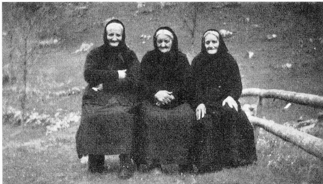
Tre sorelle vedove di 92, 89 e 87 anni

scolastici si deve seguire le orme dei padri ed emigrare nelle terre lontane, immaturi e senza preparazione alcuna alle nuove condizioni di vita. L'agiatezza del nuovo ambiente, l'idioma sconosciuto, gli usi e costumi estranei sgomentano e creano complessi d'inferiorità, talora scontentezza e risentimenti, reazione comprensibile alle reminiscenze poco liete.