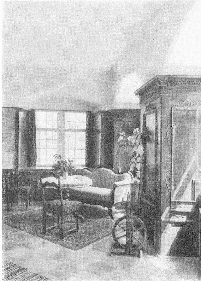
Altersheim Schloss Hauptwil Eine Ecke der grossen Stube

Charakter auf, und die Weitläufigkeit des ganzen Hauses lässt jede Vorstellung von etwas „Anstalthaftem“ verblasen. Für Einzelzimmer wird Fr. 6.50 bis Fr. 8.— berechnet, für Doppelzimmer Fr. 9.50 bis Fr. 14.50. In diesen Preisen sind vier Mahlzeiten, Wäsche und Bad, Licht und Heizung inbegriffen. Den Pensionären stehen überdies ein schönes Wohnzimmer und eine geräumige Flickstube zur Verfügung. Im bisherigen Heim werden noch Preise ab Fr. 4.— bezahlt. Der Gemeinnützigkeit wird also in hohem Masse entsprochen. Die Einnahmen werden ausschliesslich für den Unterhalt und die Niedrighaltung der Pensionspreise verwendet. Die Verwaltung wird weitgehend ehrenamtlich besorgt.