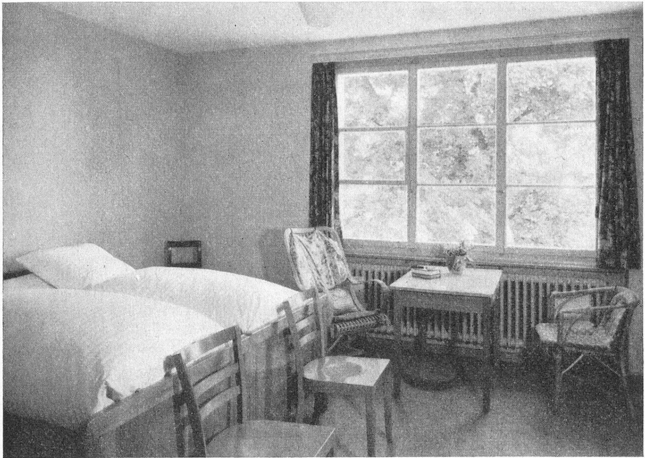
Zweier-Zimmer im Neubau