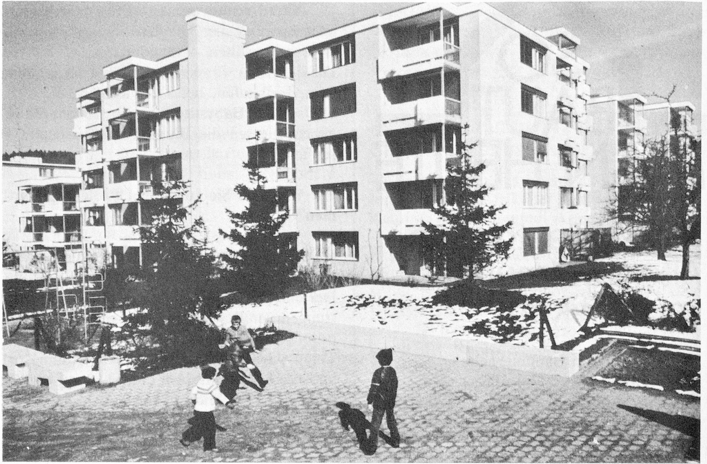
Die Ueberbauung an der Buchholzstrasse zur Winterszeit.