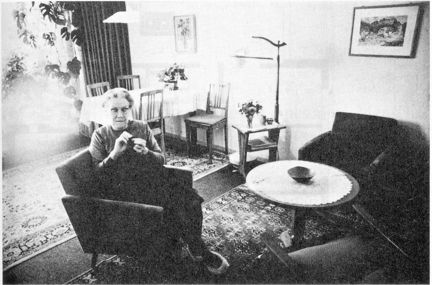
Blick in das geräumige Wohnzimmer von Frau K.