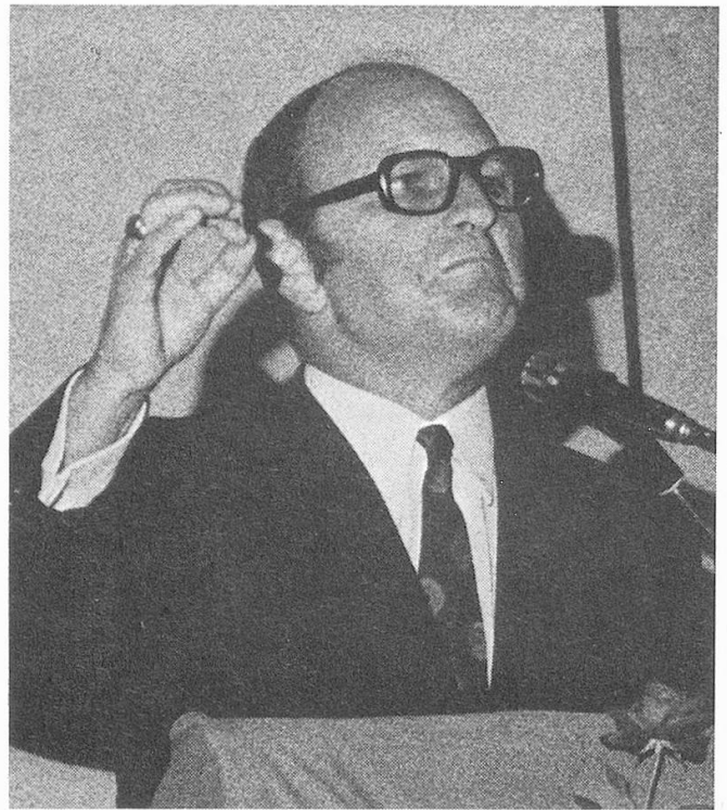
Nationalrat Dr. Paul Bürgi, FDP, St. Gallen, war Präsident der nationalrätlichen Kommission für die 8. AHV-Revision im Jahre 1972. Wir zitieren im Folgenden einige Abschnitte aus seiner Ansprache an die 1800 Teilnehmer der «Altersbegegnung» Frauenfeld am 20. Juni 1973.