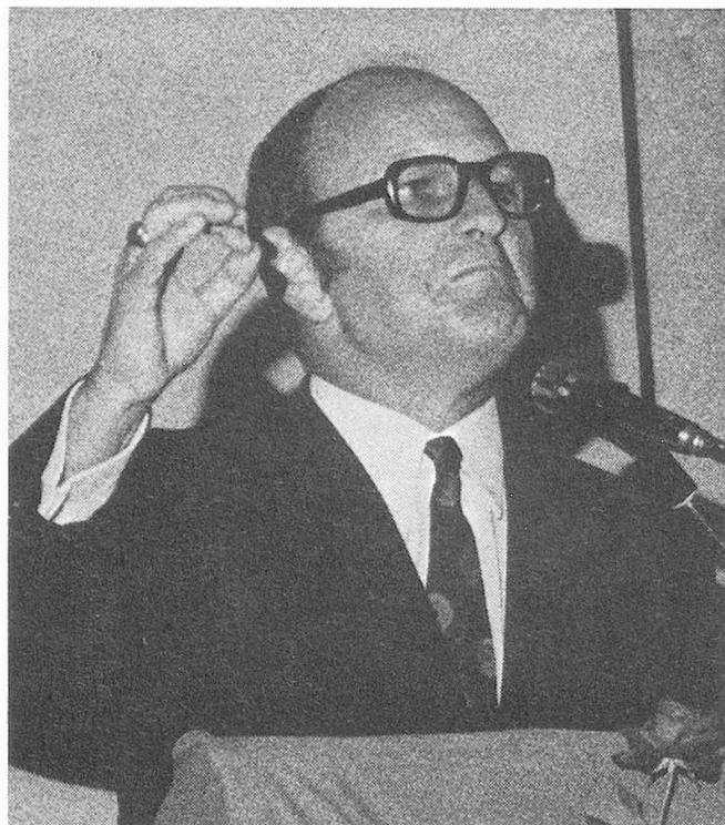
Nationalrat Dr. Paul Bürgi, FDP, St. Gallen, war Präsident der nationalrätlichen Kommission für die 8. AHV-Revision im Jahre 1972. Wir zitieren im Folgenden einige Abschnitte aus seiner Ansprache an die 1800 Teilnehmer der «Altersbegegnung» Frauenfeld am 20. Juni 1973.