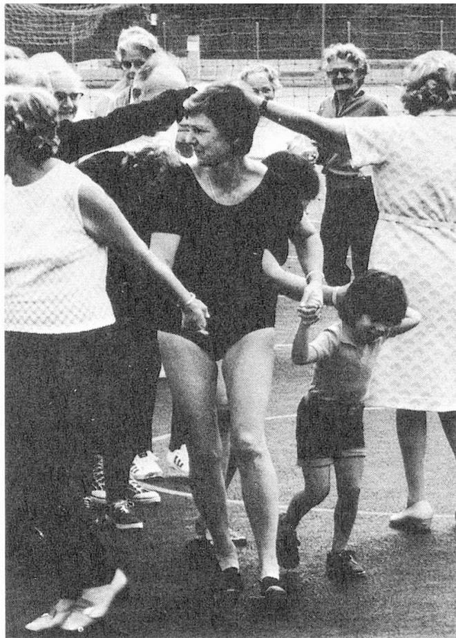
Unter vielen Betagten macht plötzlich auch eine Mutter mit ihrem Kind mit.

Abschliessend möchte ich den Brief der Leserin Frau G. P. auszugsweise bringen, sie erzählt, wie sie zu ihrem Leidwesen den Al-