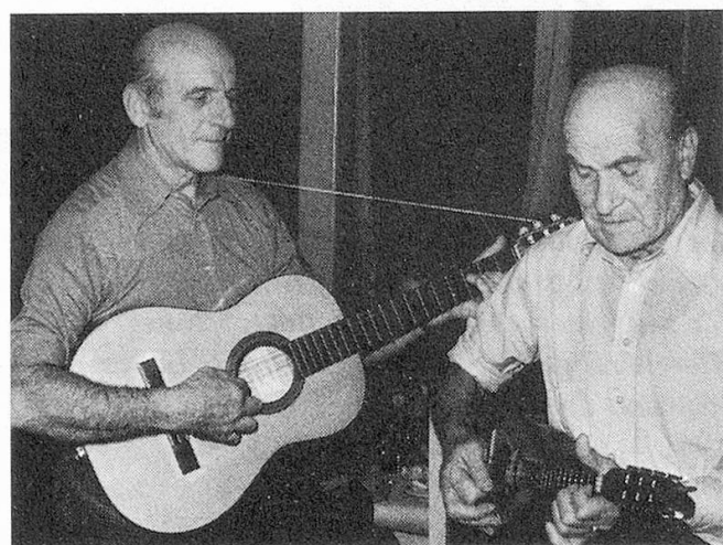
Diese beiden Senioren, die letzten Könnner ihres Faches, boten beim Nachtessen mit Gitarre und Mandoline ein buntes Programm von Tessiner Volksliedern dar.