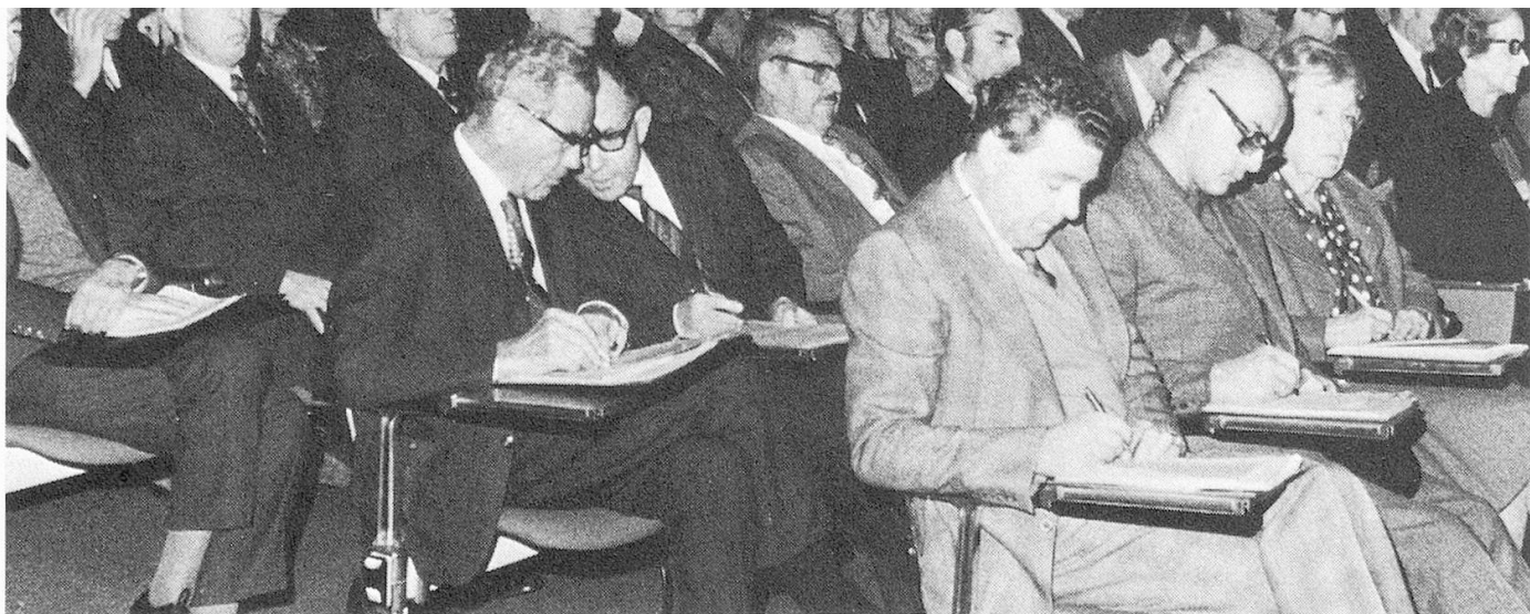
Aufmerksam folgen die Delegierten den Ausführungen vom Präsidententisch, während die Herren von der Federzunft ihre Artikel vorbereiten.