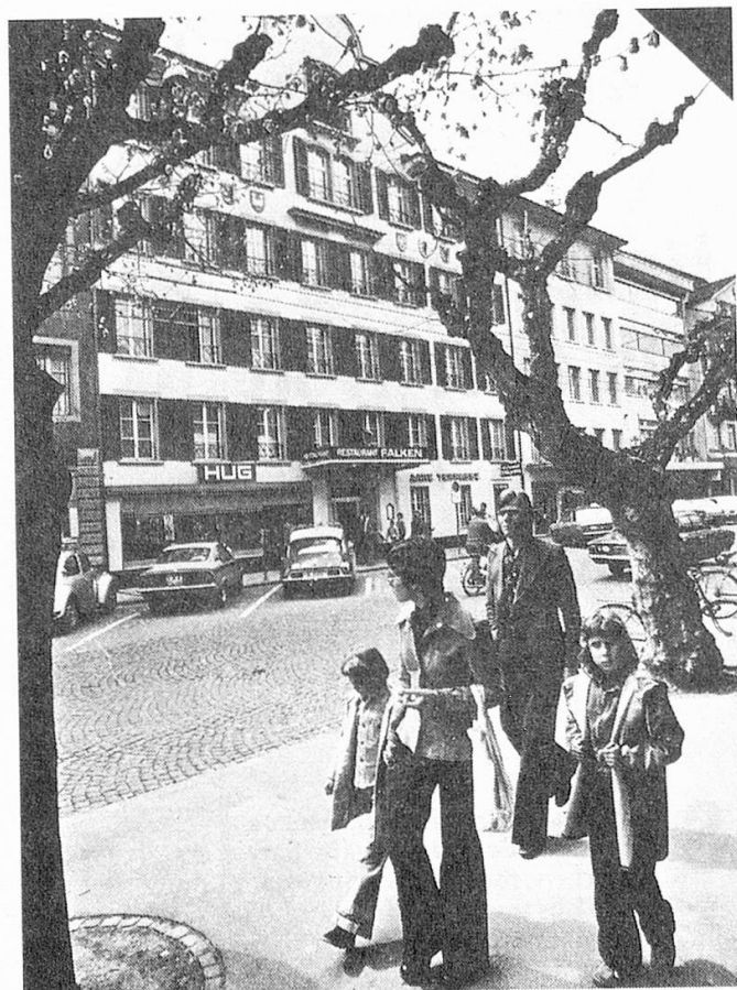
Von aussen sieht man dem Hotel Falken den Wandel zum Altersheim nicht an.