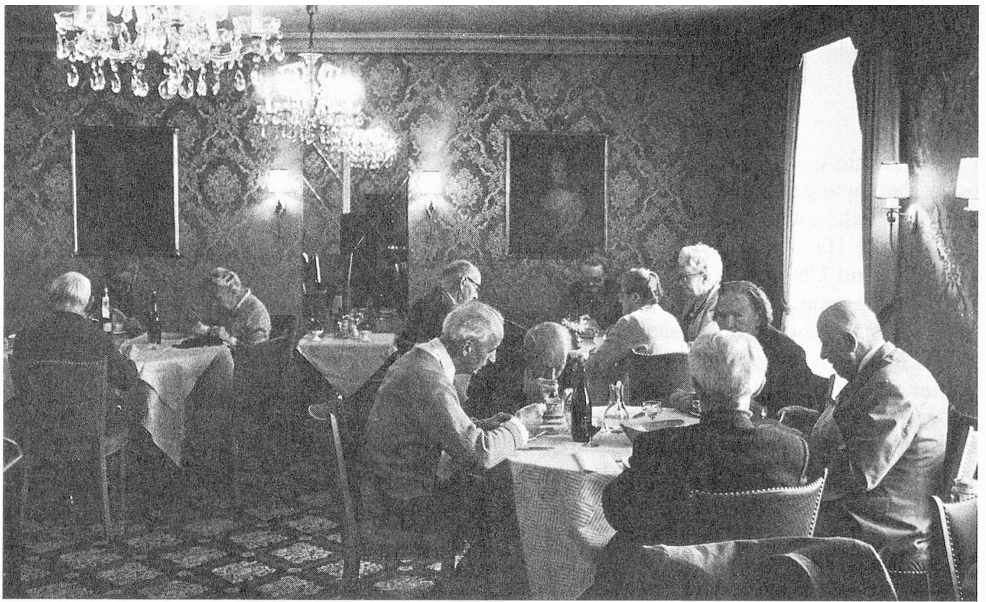
Stilvolle Kronleuchter und Seidentapeten im Speisezimmer.