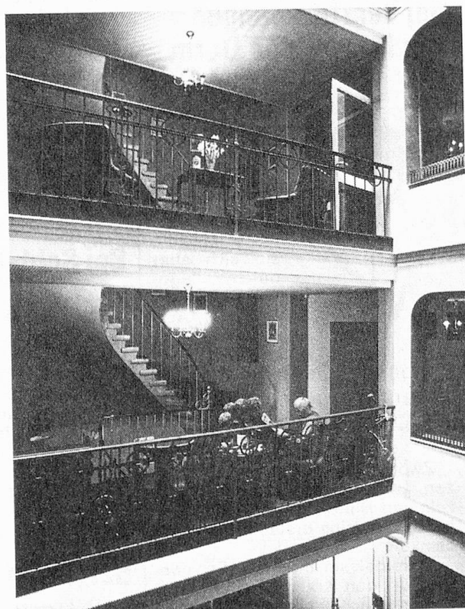
Auf jeder Etage laden gern benützte Sitzgelegenheiten zum Verweilen.