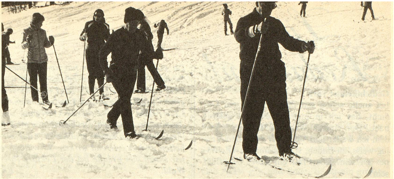
Eine von vielen Langlaufgruppen, hier die Waadtländer in Les Rasses.