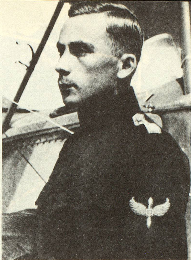
Walter Mittelholzer, geboren 1894 in St. Gallen, 1937 tödlich abgestürzt in den Bergen.

Als der Pilot aus seiner Bewusstlosigkeit erwachte, entdeckte er etwa 100 Meter über sich, an einer steilen Schneeflanke, sein total zerschmettertes Flugzeug. Vom Himmel fiel Flocke um Flocke und verunmöglichte jede Sicht und Orientierung. Als er sich mit blutüberströmtem Gesicht aus den Schneemassen befreien und talabwärts bewegen wollte, empfand er im rechten Knie einen brennenden Schmerz. Ein dumpfes Krachen kündete den Abbruch einer Lawine an, und schon im nächsten Augenblick