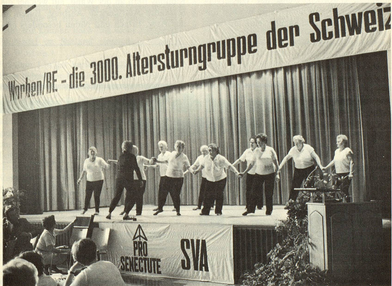
Blick auf die Bühne im Mehrzwecksaal des Seelandheims. Eben zeigt die Turngruppe Lengnau anspruchsvolle rhythmische Übungen.

Die Finanzierung der nationalen und kantonalen Kursarbeit für die über 4000 Leiterinnen und Leiter von Turngruppen erfolgt vor allem durch Beiträge des Bundesamtes für Sozialversicherung, teilweise auch durch die Eidgenössische Turn- und Sportkommission