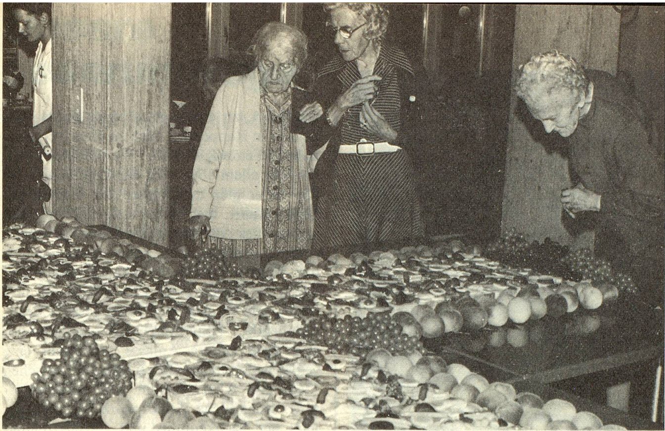
Am 1. August schuf das Küchenpersonal ein riesiges Schweizerkreuz aus belegten Brötchen und Früchten, das hier bewundert wird.

wusst wurde eine Möglichkeit gesucht, Alters- und Pflegeheim und Alterssiedlung zu kombinieren, eben ein Dreistufenheim zu schaffen.