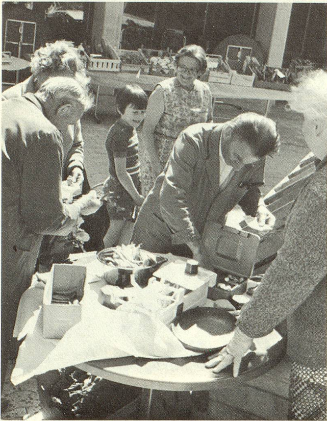
Einmalig: Markt im Alterszentrum mit drei älteren Bewohnern als Verkäufern.