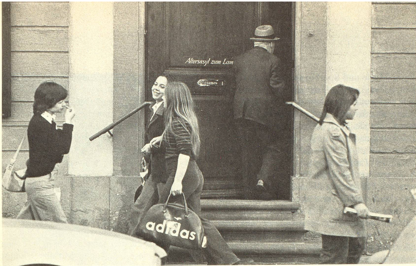
Das junge Leben geht am «Altersasyl» vorbei.