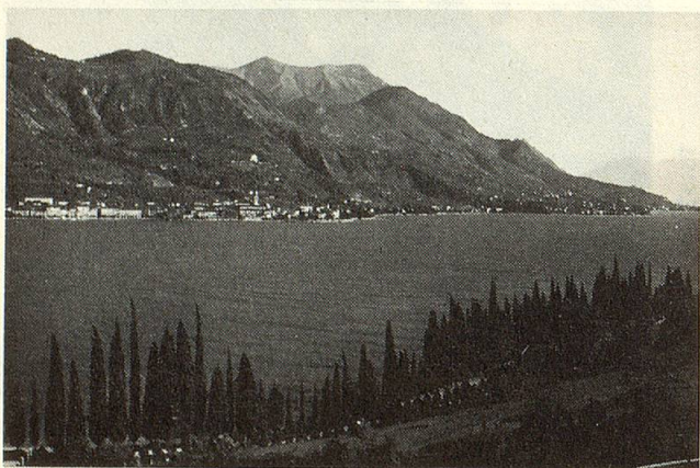
Der immerblaue Gardasee