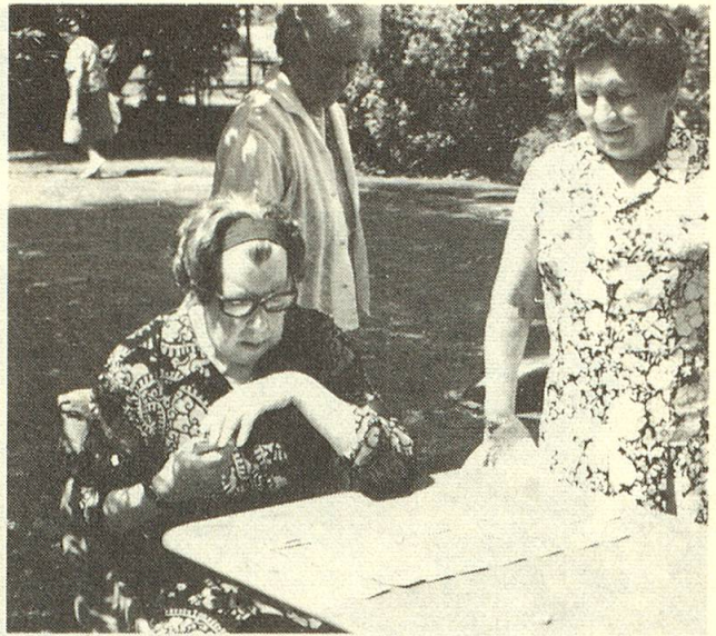
Patiencespieler finden immer Zuschauer.

mehr. Wäre es nicht schade um das sich über Jahrhunderte hinweg bewährende Spielgut, wenn es in Vergessenheit geriete?