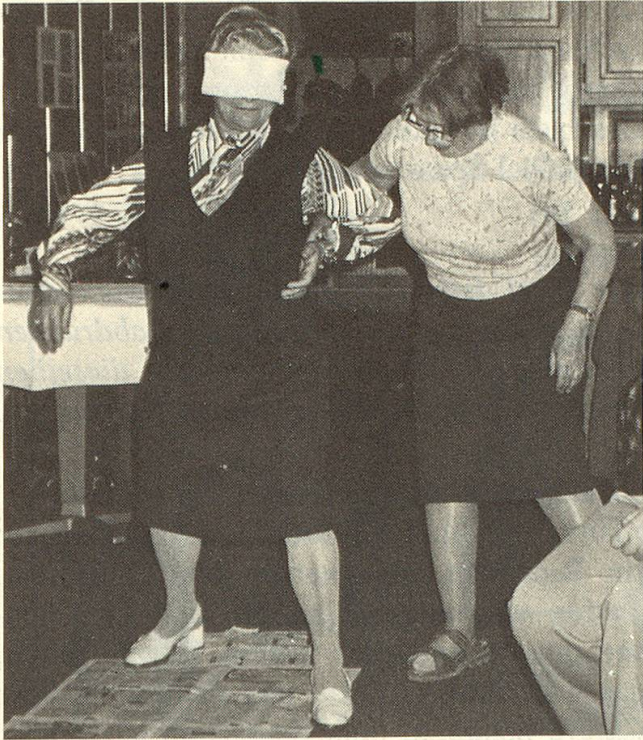
Ein lustiges Blindkuhspiel in den Seniorenferien.