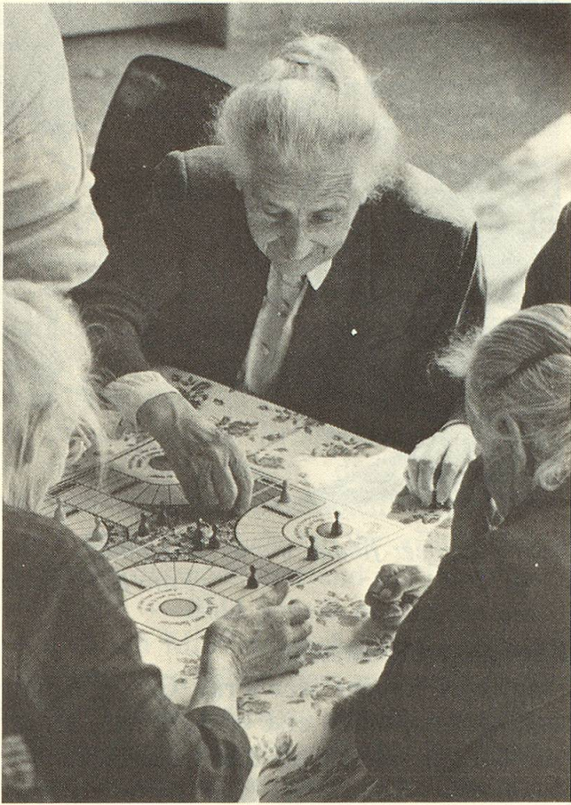
Ganz bei der Sache sind diese Frauen in einem Altersclub.