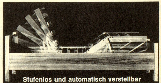
Stufenlos und automatisch verstellbar

v. K: Die Fussdeformationen sind häufig vererbt im Sinne einer Bindegewebsschwäche. Wichtig ist das frühzeitige Erkennen der Veränderungen, denn Vorbeugen ist immer besser