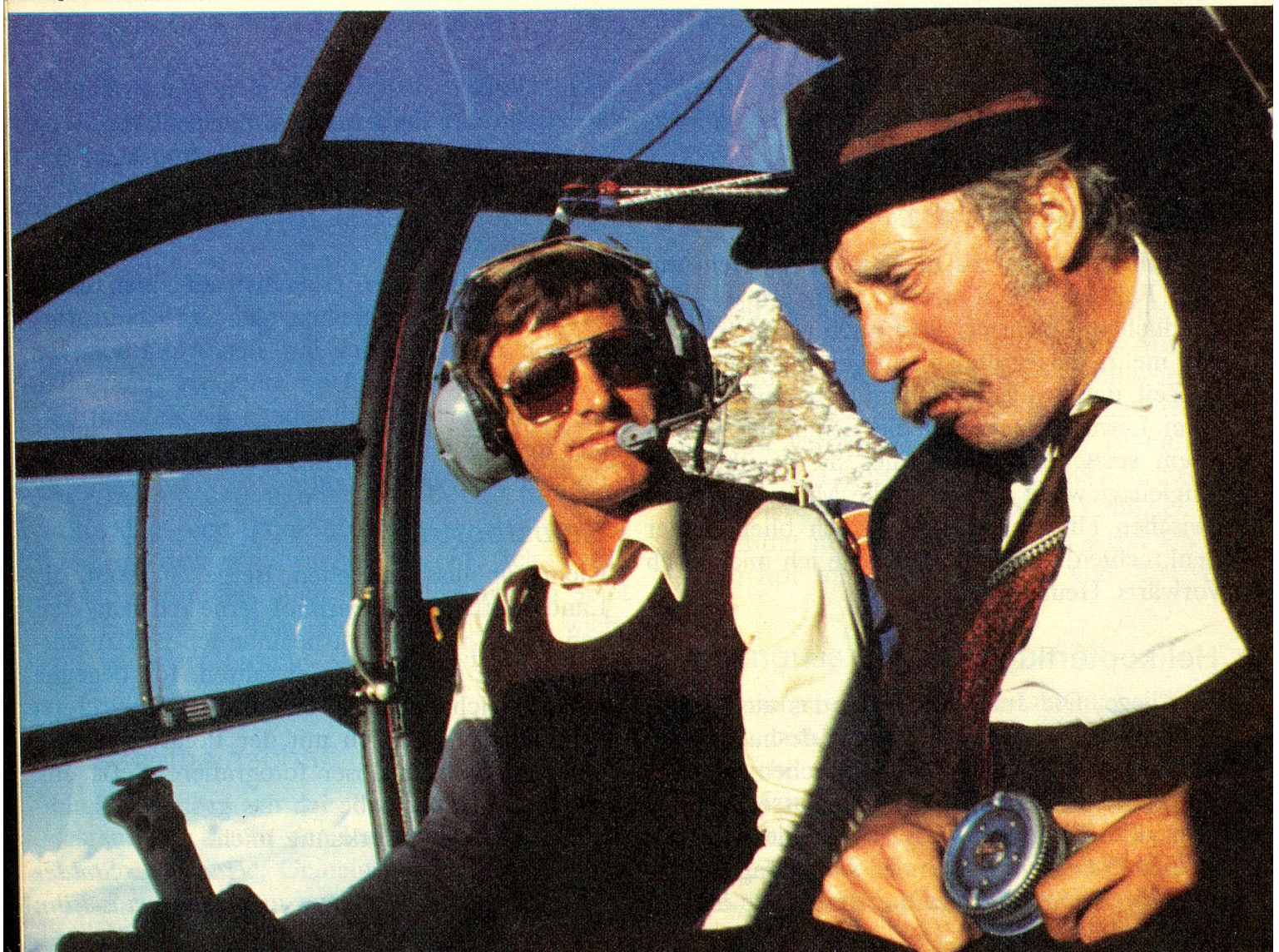
...und beim Alpenrundflug im Helikopter.