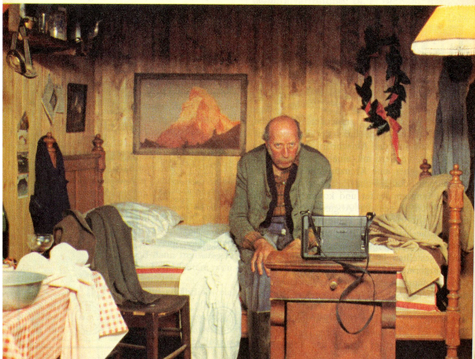
... und vor seiner Polaroidkamera mit Selbstauslöser.