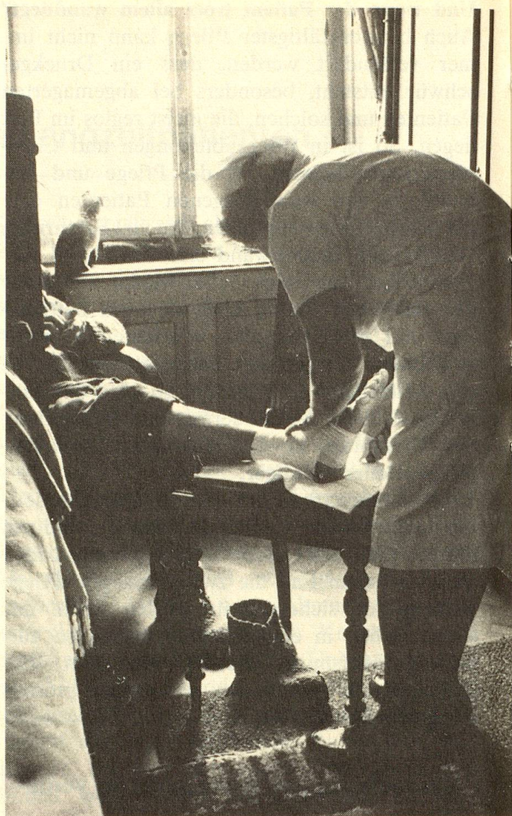
Bei ihrem Besuch verbindet die Gemeindeschwester einen offenen Fuss.

ZL: Was sind Ihre häufigsten weiteren Dienste?