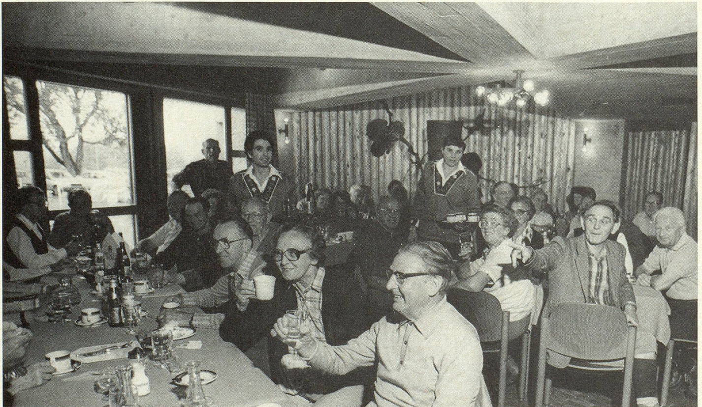
Alte und Junge treffen sich zu einem Umtrunk in der «Dorfbeiz».

An der Stelle des Neubaus stand hier einst das Kurhaus Twannberg, das Erholungssuchenden und Tausenden von Wanderern als gern besuchte Gaststätte diente. Nach finanziellen Schwierigkeiten wurde es als Ferienlager- und Ferienkoloniehaus für Bieler Kinder weitergeführt, und schliesslich — im Jahre 1958 — der Schweizerischen Stiftung Pro Juventute geschenkt. Die Liegenschaft sollte als Ferienheim für Kinder oder für andere Pro Juventute-Aufgaben Verwendung finden. Falls aus finanziellen oder andern Gründen die Zweckbestimmung nicht mehr erfüllt werden könnte, wurde Pro Juventute ermächtigt, die Liegenschaft zu veräussern oder einem ähnlichen sozialen Zweck zuzuführen, wobei aber auf jeden Fall