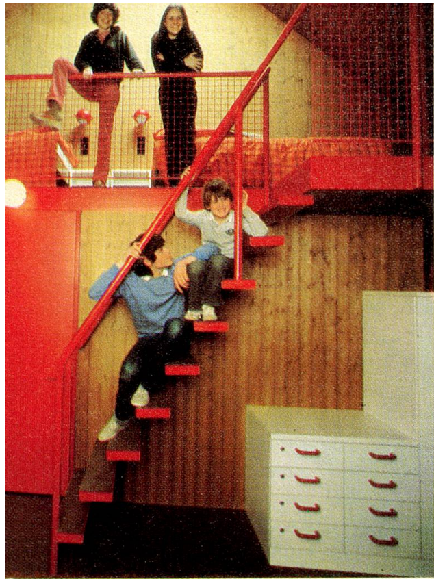
die Jungen sind Treppe und Obergeschoss lausch.

Erfolg das Familien-Feriendorf «Bosco della Bella» im Tessin gebaut hatte.