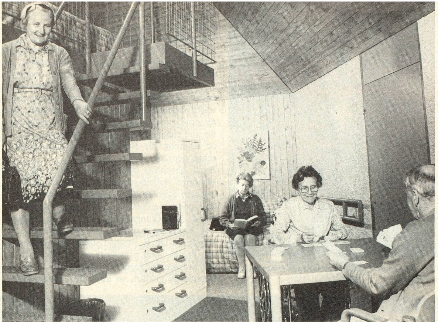
Vier (ältere) Gäste teilen sich in einen Pavillon: zwei erklimmen die Galerie und sehen vom Bett aus den Himmel, zwei schlafen unten.

eine Gaststätte für Wanderer und Ortsansässige erhalten bleiben müsse.