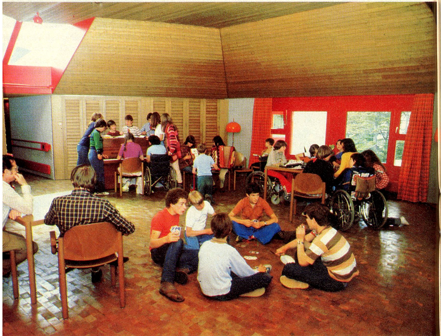
openraum für Arbeit, Spiel und Fernsehen, darum herum liegen die Wohnpavillons.

Nach Abschluss der Planung konnte 1977 die bisherige Arbeitsgemeinschaft in eine Schweizerische Stiftung «Feriendorf Twannberg» umgewandelt werden. Pro Juventute übergab in einem Schenkungsvertrag der neuen Stiftung das bisherige Kurhaus mit Umgelände. Alt Bundesrat Dr. E. Brugger stellte sich voll hinter das Projekt und präsidiert seither die Stiftung mit grossem Engagement. Somit war auch die Rechtslage geklärt, so dass die Mittelbeschaf-