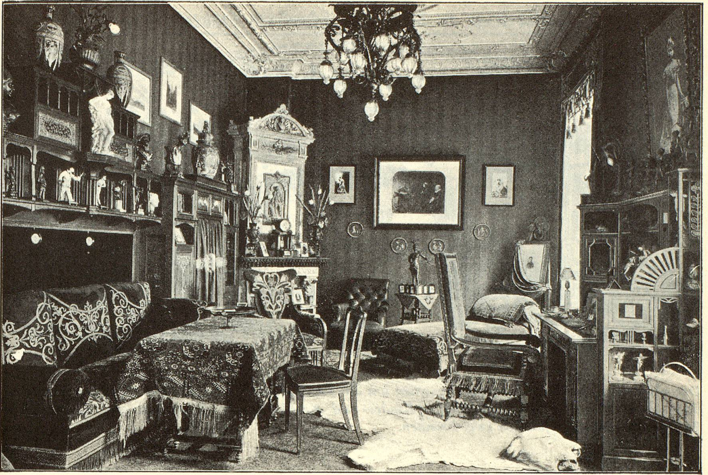
«Wohnzimmer», Inserat der kunstgewerblichen Werkstätten Furtwängler AG, Zürich, aus «Erinnerungen an die Brautzeit», einem Katalog für die Braut.

-Bordüren hat's nicht gemangelt. Der Herr geht in Vatermörderkragen des Modells Mozart, Zollern, Paris, von denen samt Manschetten, fünffach Leinen, das Dutzend auf Fr. 6.— bis Fr. 10.50 zu stehen kommt. Die Frauen zeigen sich langberockt mit Wespentaille, Mädchen und Knaben mit Vorzug in Matrosenkleidchen, das Stück zu 8 bis 12 Franken. Auch hier hat jedes Modell einen Namen, und die Auswahl ist, nicht nur im Sektor Kleider, sondern auch an Toilettenartikeln, Eisenbetten, Stoffen, Posamenterien und Accessoires überwältigend.