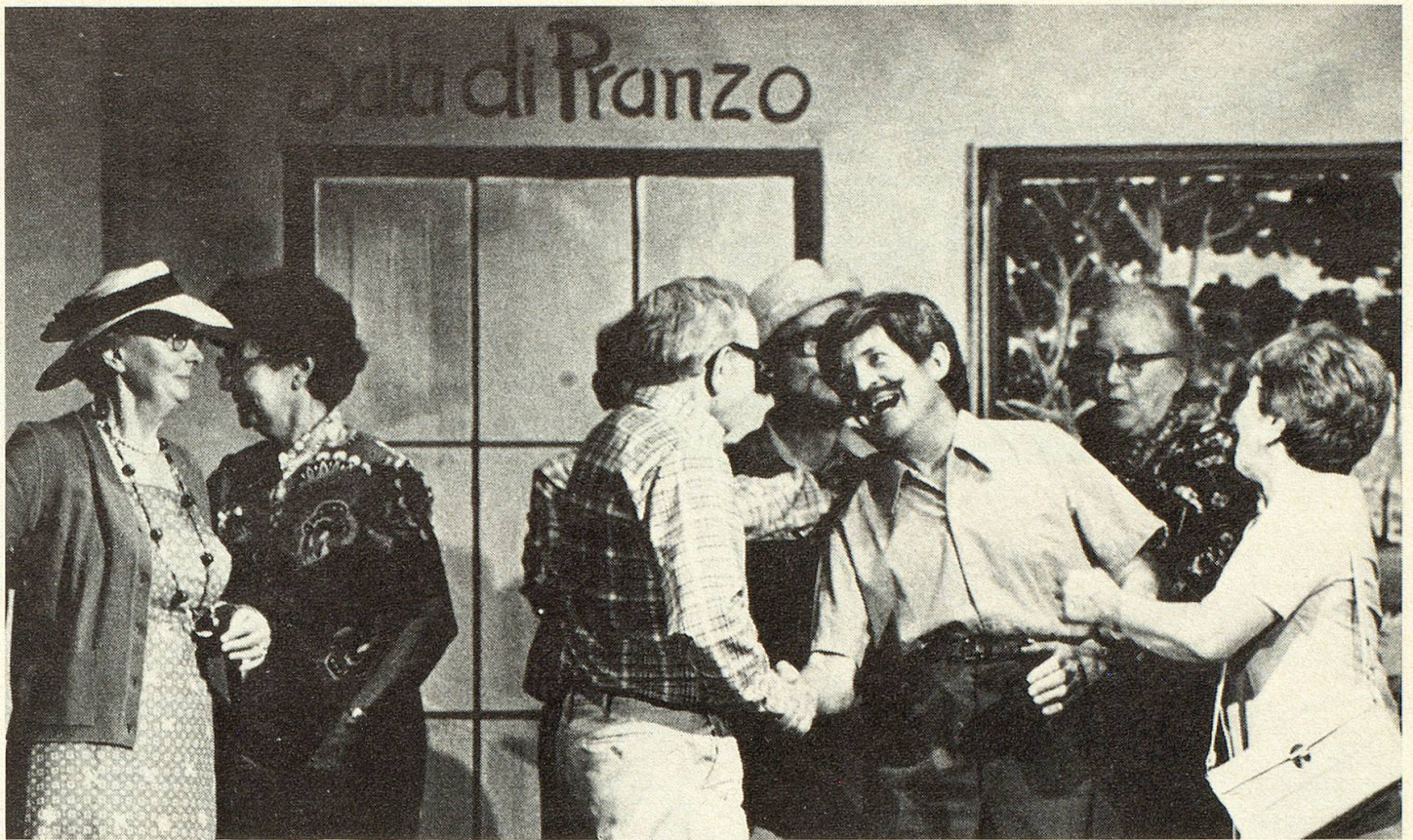
Dieses Szenenbild aus «Alti wämer nanig sy» zeigt das natürliche Spiel der Senioren vor den selbstgemalten Kulissen — hier in einer Hotelhalle in Italien.