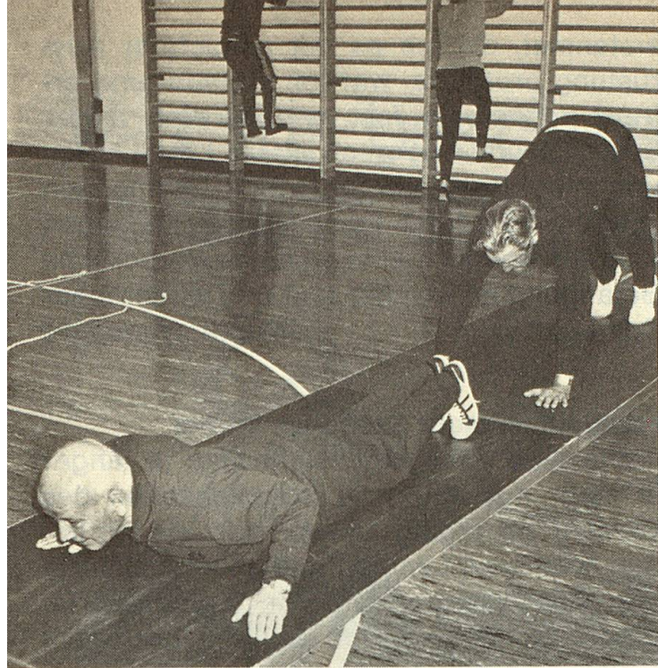
Langlauftraining mit Bodenübungen.

dert er mit seiner Frau in der Umgebung, ihre Gesundheit ist nicht mehr so gut, doch sollte sie viel gehen.