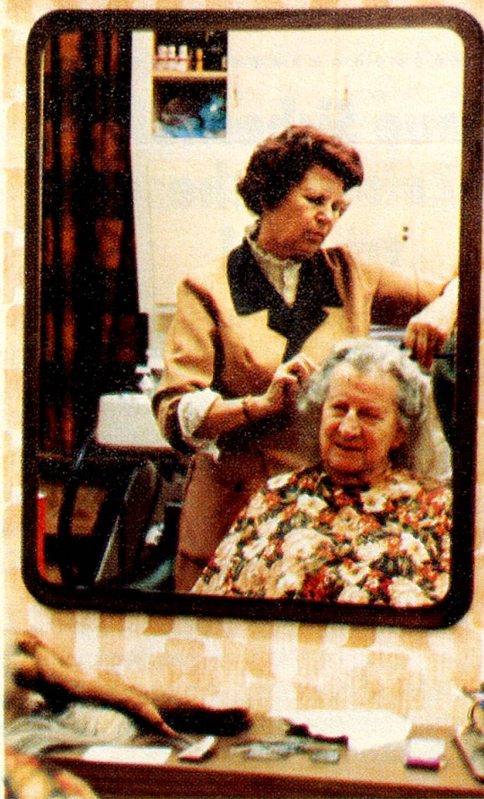
Ganz nach Wunsch werden die Haare onduliert. Aeltere Fachkräfte haben diese Kunst von Grund auf gelernt.