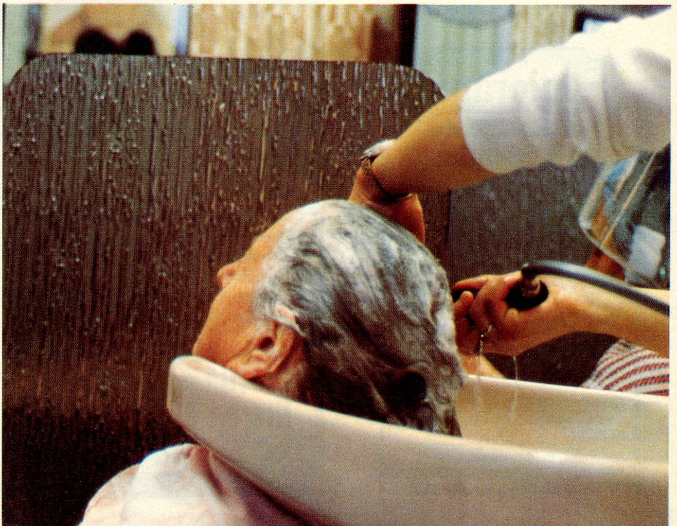
Entspannt und zufrieden lässt sich die Kundin von einer Lehrtochter die langen Haare waschen.