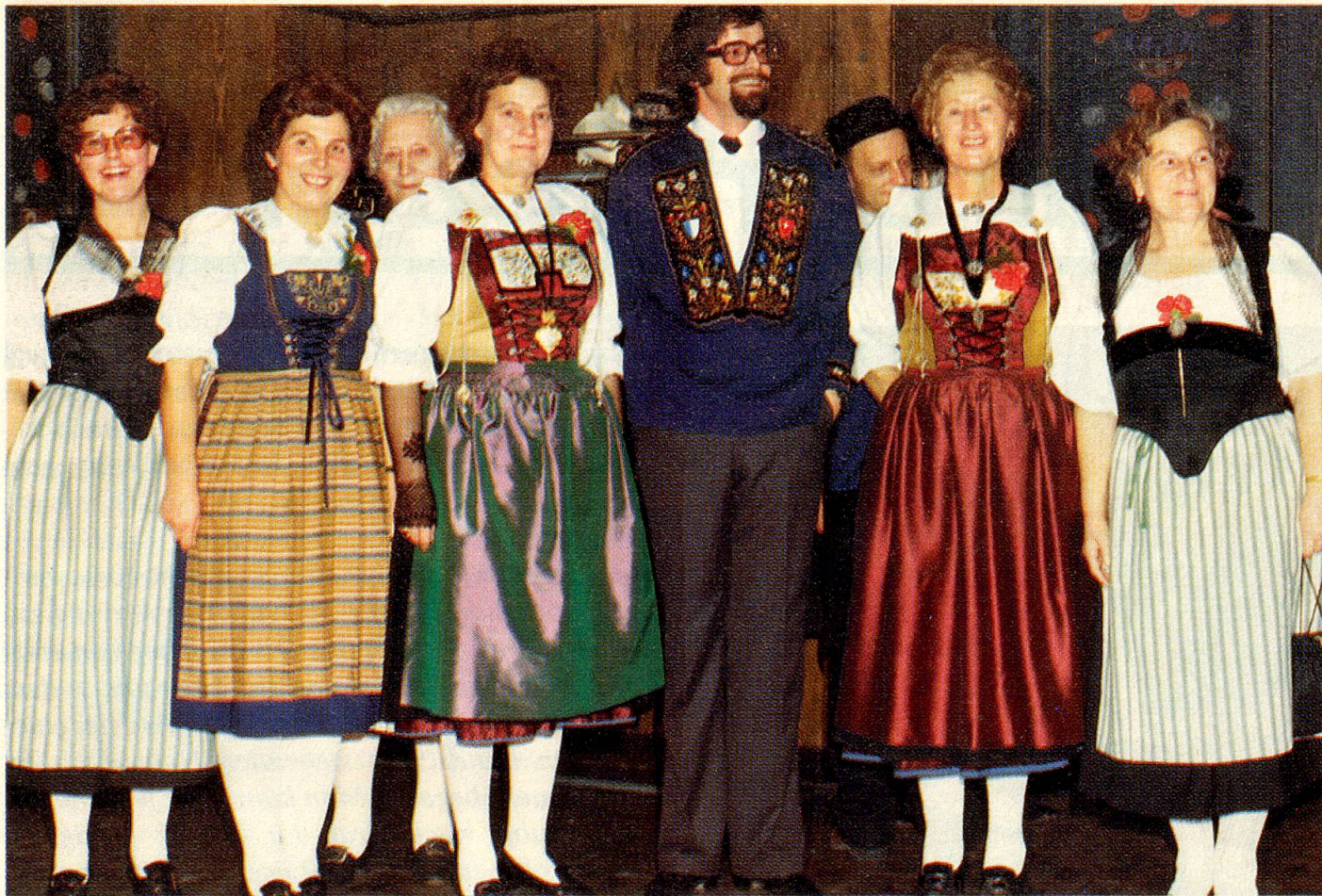
Alt und jung finden sich in der gemeinsamen Liebe zum Volksgesang.