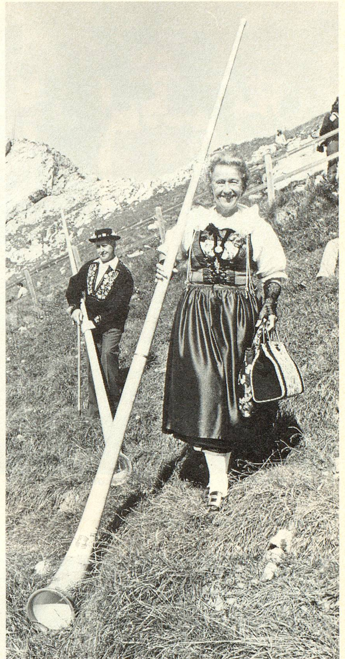
Es braucht kräftige Lungen zum Alphornblasen und zupackende Hände, um das fast 4 m lange und ca. 6 kg schwere Instrument zu tragen.

Die Tage sind ausgefüllt, sie muss gut einteilen, um allem gerecht werden zu können. Sie würde es natürlich geniessen, wenn ab und zu jemand für sie da wäre, wenn sie nicht immer allein alles organisieren und planen müsste. Im Auto neben dem Fahrer sitzen zu dürfen und nicht selber zu chauffieren, ist ein Wunschtraum. Nicht immer andere verwöhnen, einmal verwöhnt werden,