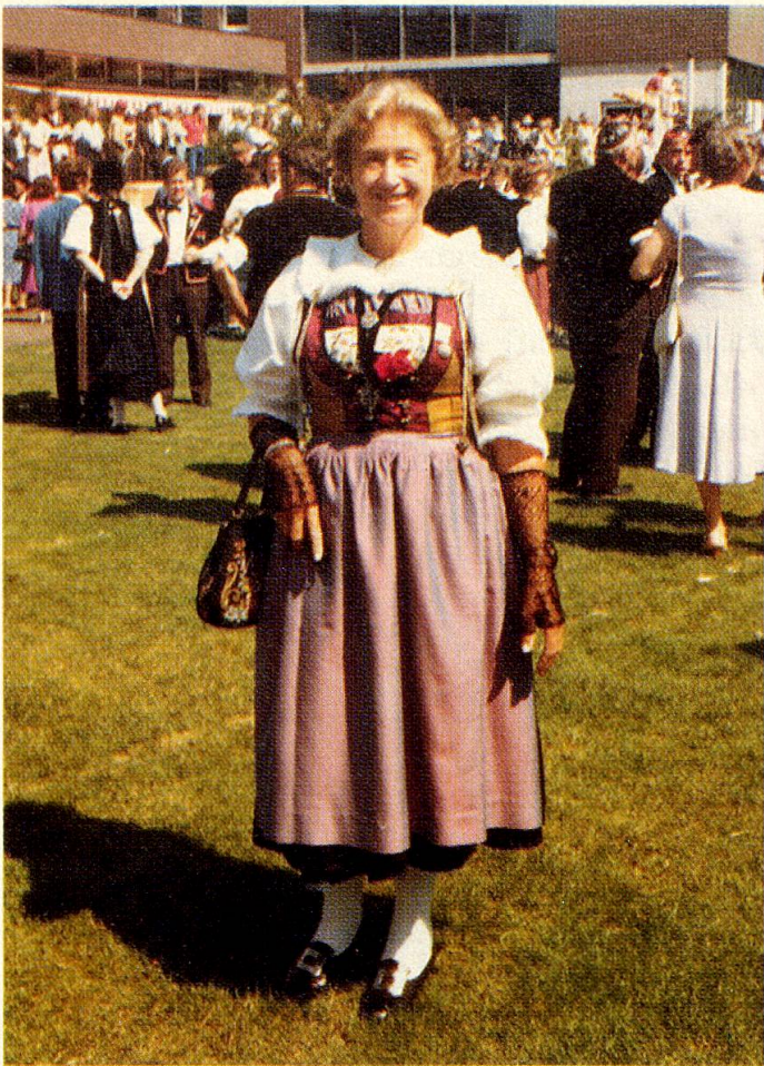
Mit der schmucken Luzerner Tracht auf der Festwiese.