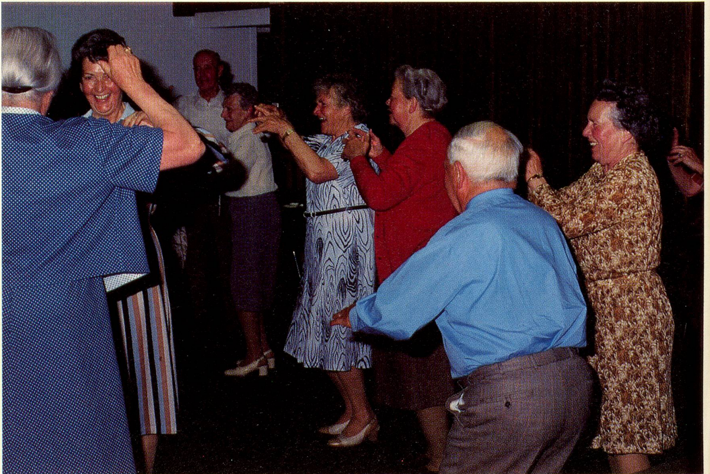
Die Polonaise am Bunten Abend scheint allgemein Anklang zu finden