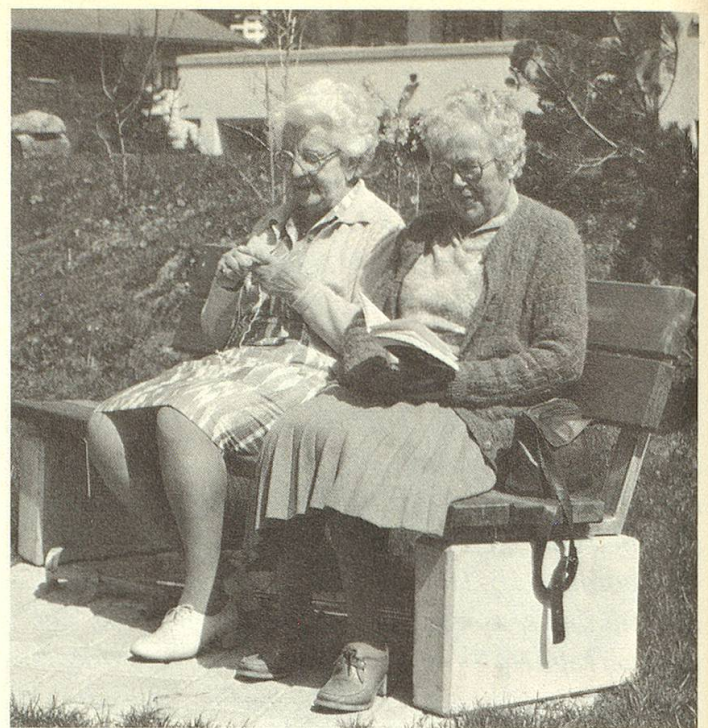
Stricken und Lesen an der Bergsonne gehören auch zum FERIENGEFÜHL