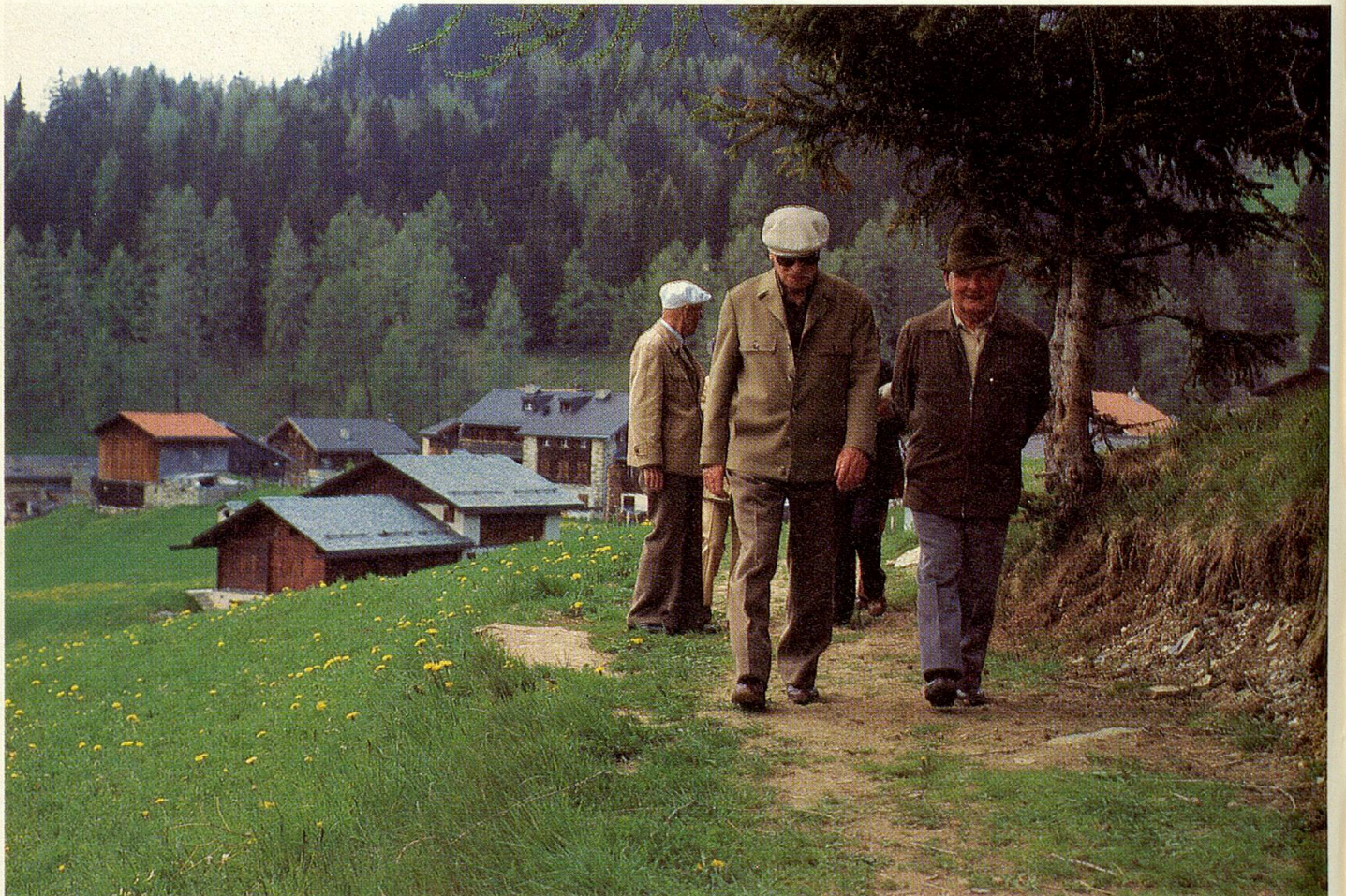
Geruhsamer Aufstieg eines Herrenquintetts nach Sartons