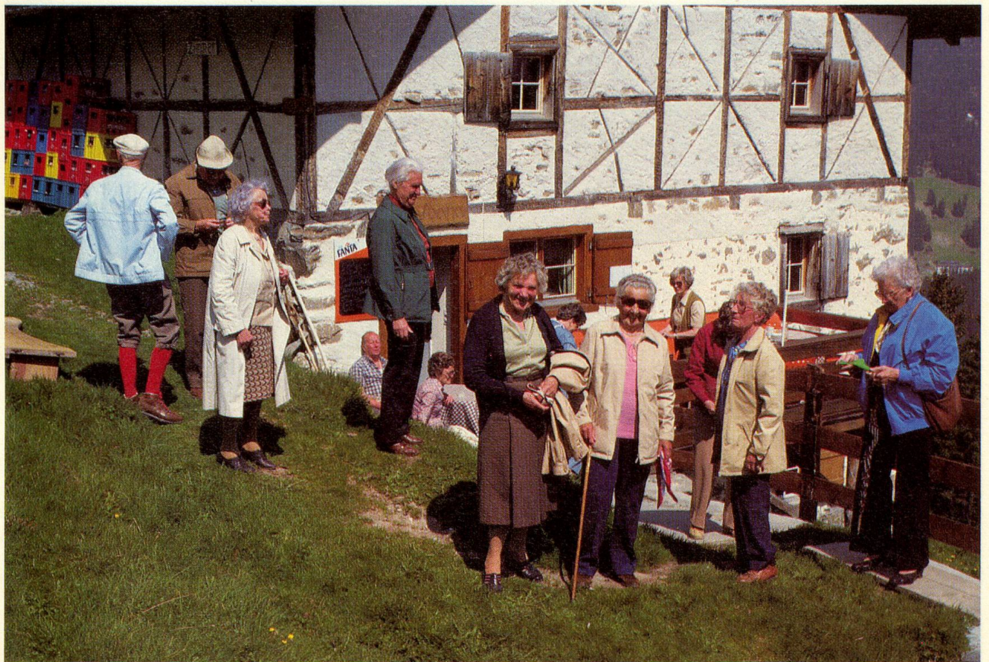
Aufbruch nach dem Kaffeehalt von der Maiensäss Spoina