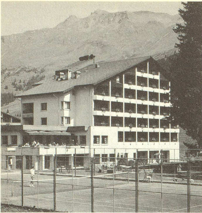
Einmal im Jahr lässt sich's zur Not im «Valbella Inn» schon aushalten ...

Wolken die Gegend. Im Hotel «Valbella Inn» wurden wir liebevoll empfangen. Wir waren alle zufrieden mit den schönen Zimmern. Das Mittagessen war so fein und nahrhaft, dass man alles andere vergass, sogar den leichten Regen. Wir ruhten uns aus und gingen dann trotz des nassen Wetters spazieren. So ging ein schöner erster Tag zu Ende. Was uns immer wieder auf die Beine stellte, war das Frühturnen und nachher das gute und ausgiebige Morgenessen, ach, wie war das schön!