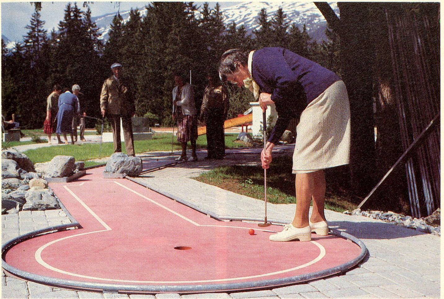
Auch ältere Semester lassen sich beim Minigolf vom Ehrgeiz packen