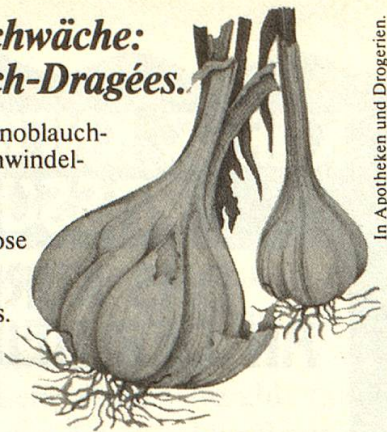
In Apotheken und Drogerien.