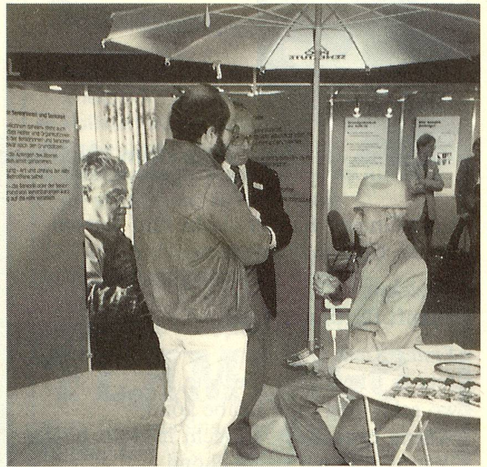
Die Sitzgelegenheiten waren höchst willkommen, es tat gut, die müden Füsse ausstrecken zu können. Foto es

Erstmals beteiligte sich Pro Senectute in diesem Jahr mit einem Informationsstand an der OLMA, der Schweizer Messe für Land- und Milchwirtschaft. Schrifttafeln, Bilder, Prospekte und eine Fernseh-Tonbildschau machten auf die mannigfachen Dienstleistungen unserer Stiftung aufmerksam, wobei aus naheliegenden Gründen das Angebot und die Möglichkeiten in der Stadt und im Kanton St. Gallen hervorgehoben wurden. Einen weiteren thematischen Schwerpunkt bildete das Wohnen daheim.