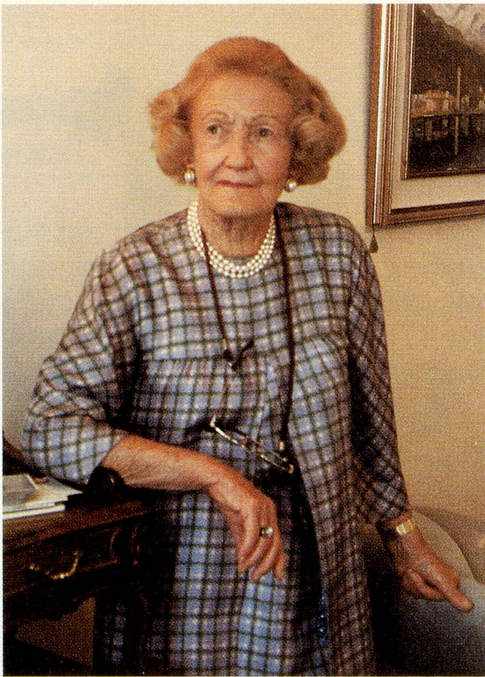
Auch mit 80 Jahren Dame von Kopf bis Fuss.