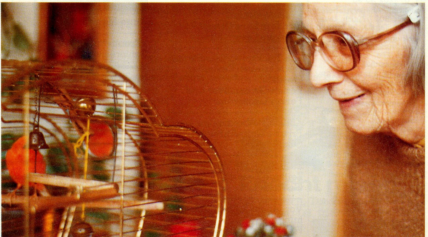
Die Beziehung Mensch–Tier hat viele positive Auswirkungen.

Allmählich hörten die Menschen der zweiten Gruppe (und nur diese!) damit auf, über ihre Gebrechen und Schmerzen oder die Unannehmlichkeiten des Lebens zu klagen. Sie diskutierten stattdessen mit anderen Leuten über ihren neuen Wohnungsgenossen. Das Heimtier erleichterte nicht nur Kontakte zu den Mitmenschen, auch das Selbstwertgefühl wurde gestärkt, ebenso wie die geistige Frische und die allgemeine Zufriedenheit.