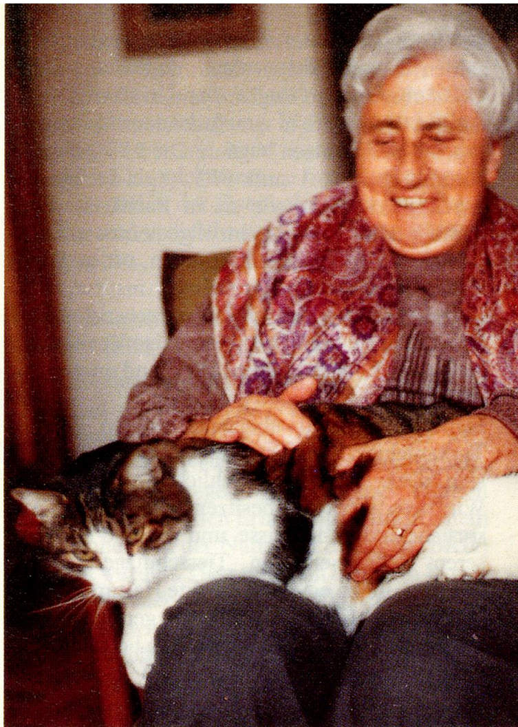
... und wollen umsorgt sein.

Hunde wurden bereits als «die wahren Therapeuten für den Ruhestand» bezeichnet, und es ist