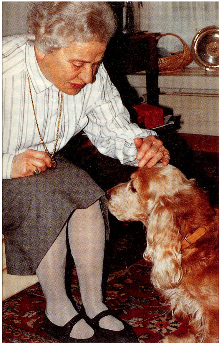
... verbreiten Freude ...

re erleichtern und ermöglichen Kontakte zu anderen Menschen. Über das Heimtier kommen Menschen miteinander ins Gespräch, können sich Bekanntschaften entwickeln.