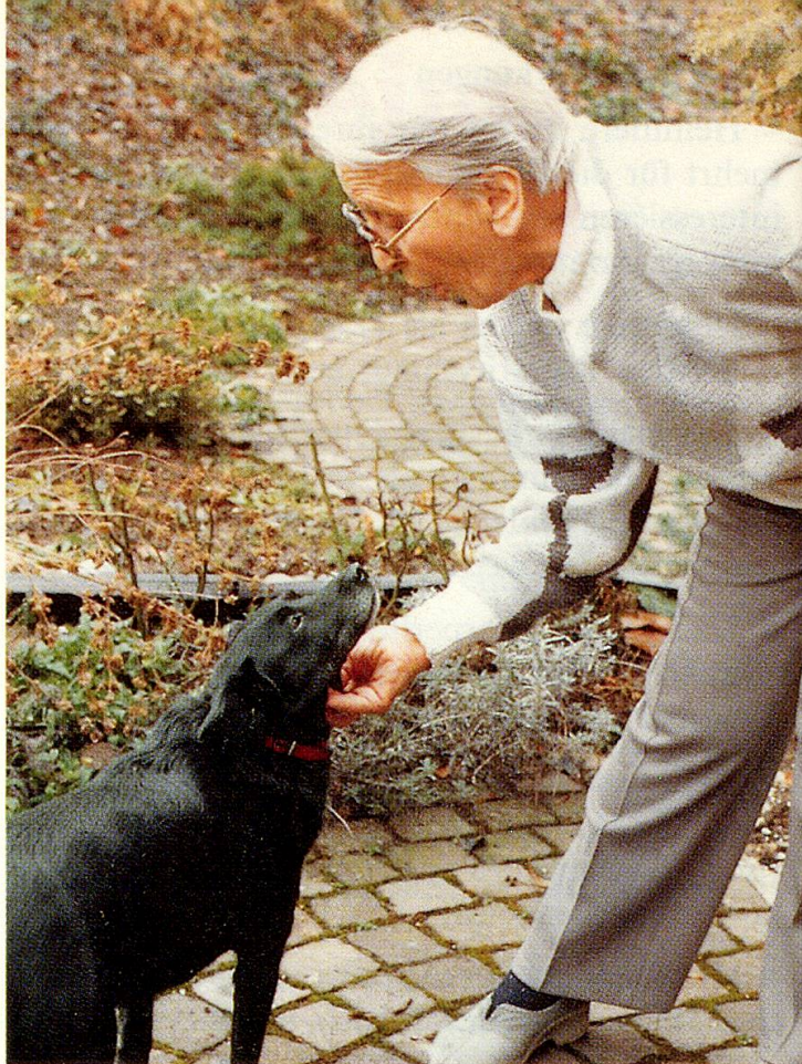
Tiere animieren zum Spielen ...

Sorgen für Abwechslung: Im Gehege neben dem Alters- und Pflegeheim «Drei Linden» in Oberwil/BL. Einmal pro Woche erhält sogar jeder der etwa 80 Pensionäre ein frisches Ei.