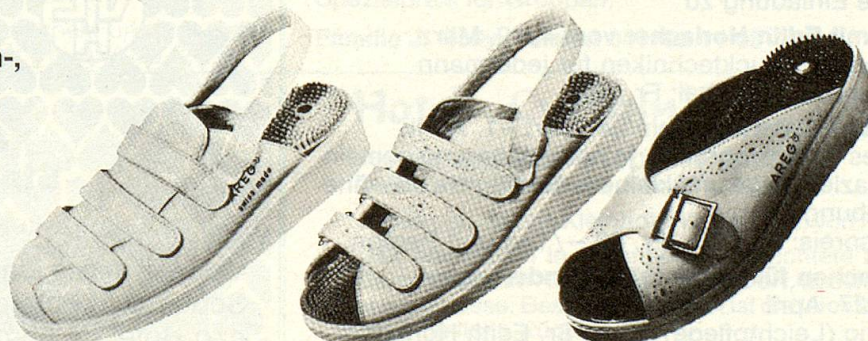
AREG® Modell 1

Echt Leder, Grössen 36–47 in weiss, dunkel- braun und lackschwarz, jedes Paar SFr. 170.–