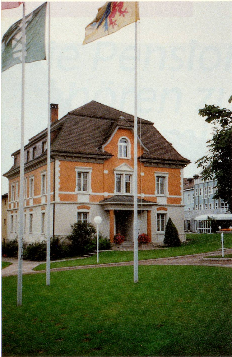
Unverkennbar, dass die «alte» Rosenau einst als private Villa gebaut wurde.