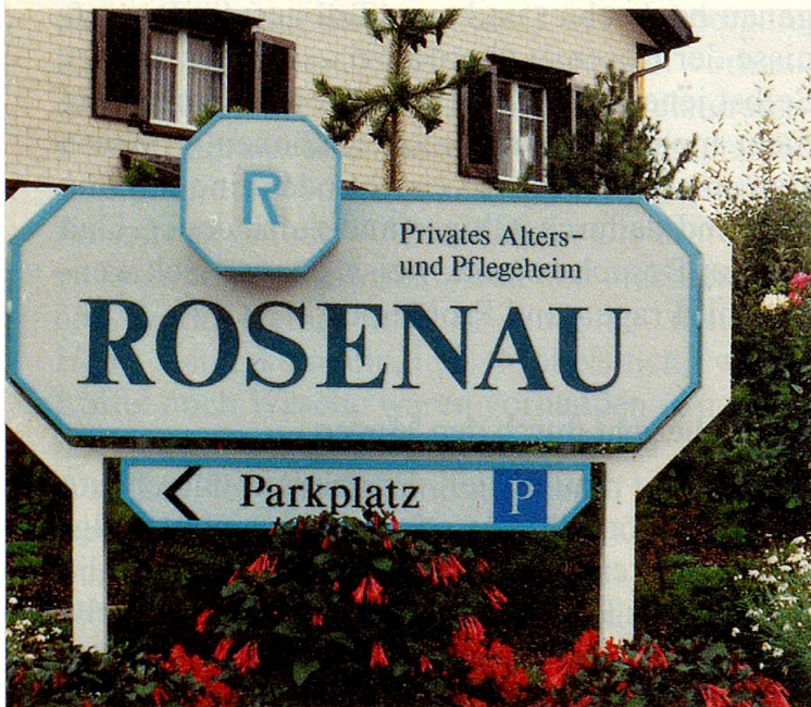
Nur das von blühenden Pflanzen umwachsene Schild mit dem diskreten Signet weist darauf hin, dass hier pflegebedürftige Menschen leben.

Sie genießen die freundliche, aufmerksame Bedienung und bemühen sich ihrerseits, lebenswürdig zu sein und möglichst korrekt zu essen, auch wenn es schwer fällt, mit Messer und Gabel umzugehen. So kann eine gepflegte Umgebung – fast wie in einem eleganten Hotel-Speisesaal – sogar Hilfe zur Selbsthilfe sein.