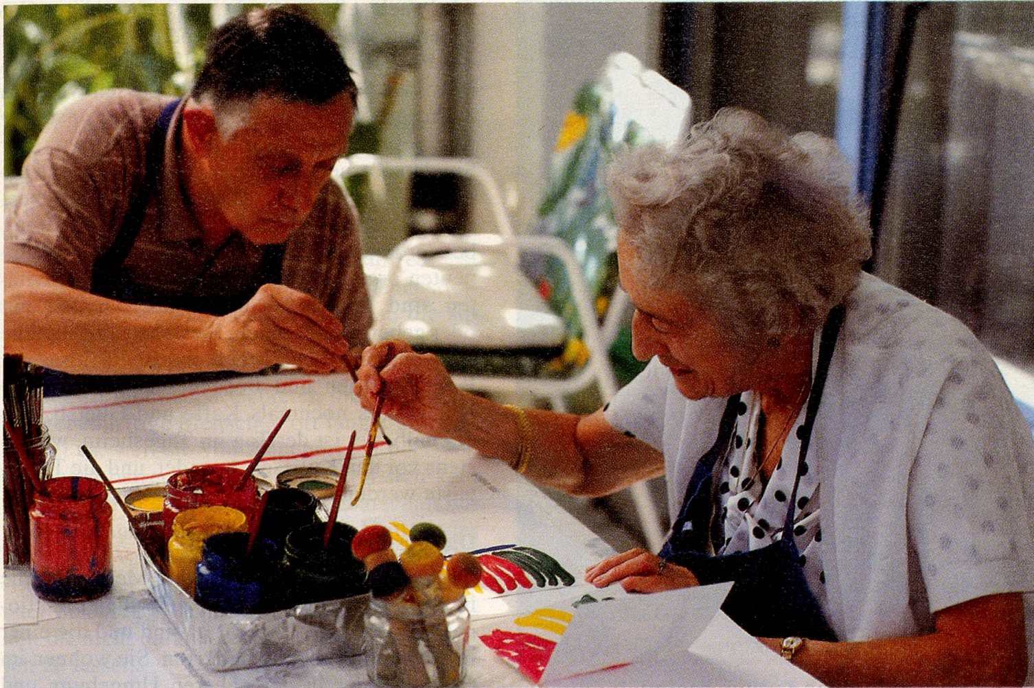
Tagesheim: Zusammen malen macht Freude.