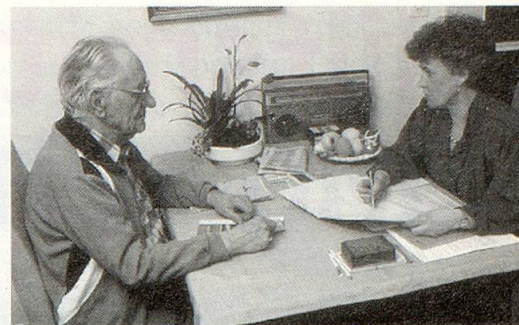
Im Gespräch mit der Sozialarbeiterin wird nach einer Lösung gesucht.

Das Tonbild geht über ein Selbstporträt hinaus, vergisst nebst Vergangenheit und Gegenwart auch die Zukunft nicht. Denn Fragen, die uns alle angehen, warten auf Lösungen: Die Sicherstellung der Renten, der Personalbedarf in der Altersarbeit, die Entwicklung von neuen Wohn- und Lebensformen. Spontanaussagen über das Alter von Personen verschiedenen Alters runden das Porträt ab.