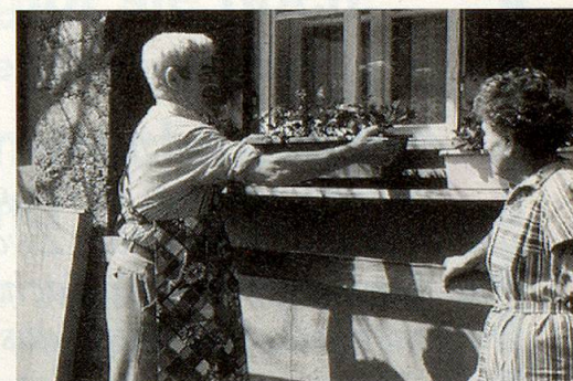
Pro Senectute regt Senioren an, anderen älteren Menschen ihre Dienste anzubieten.