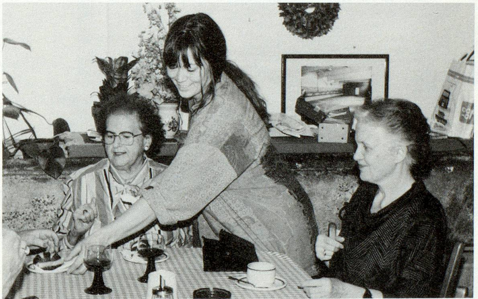
Der Mittagstisch: Meistens trifft man jemanden, mit dem man essen und auch plaudern kann.

lerateliers, eine Kinderkrippe, die Videogenossenschaft, ein Boxclub und das Kasernenschulhaus gehören ebenfalls dazu. So können Kontakte über Generationen hinweg zustandekommen.