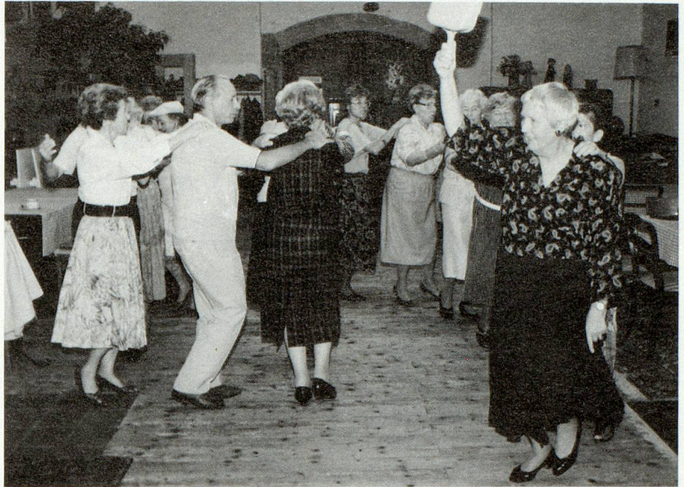
Einmal im Monat laden die Grauen Panther zum Tanz.

Aber nicht nur der Spiel-Estrich hat hier Unterkunft gefunden. Da gibt es noch das Kaffi Schlappe für Jugendliche, die Kulturwerkstätte, auch die islamische Gemeinde genießt hier Gastrecht. Viele Künst-