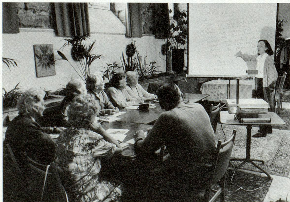
In gemütlicher Atmosphäre lernt es sich leichter.

Am 14. September 1985 konnten die Räumlichkeiten des Seniorentreffpunktes in der Kaserne Basel eingeweiht werden. Bis es so weit war, brauchte es von den Beteiligten eine gehörige Portion Optimismus, Einsatzwillen und Tatkraft, um den düsteren Raum, in dem einst Pferde ihren Hafer gefressen hatten, mit Hilfe arbeitsloser Handwerker in einen Treffpunkt für Betagte umzubauen. Das Mobiliar stammte aus Wohnräumen des Pro-Senectute-Transportdienstes und fand hier mit Einwilligung der früheren Besitzer einen neuen Verwendungszweck. Die Pflanzen, die in den ehemaligen Futterkrippen des früheren Pferdestalles wachsen, die selbstgefertigten Vorhänge und die gewürfelten Tischtücher machen aus dem Raum heute eine «Wohnstube». Der Raum in der ehemaligen Kaserne – geplant als Werkstätte – entwickelte sich zu einem beliebten Begegnungszentrum.