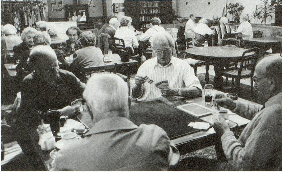
Am Montagnachmittag treffen sich die Jasserinnen und Jasser.