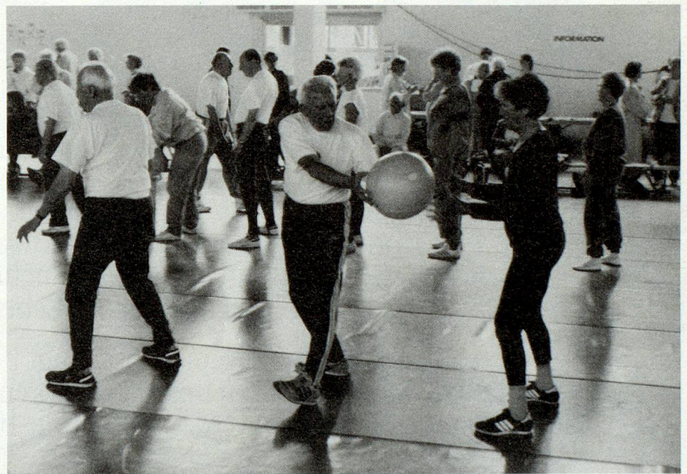
Wer gewinnt bei der Ball-Stafette?